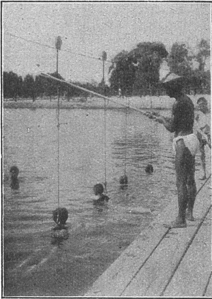
Wiener Schwimmunterricht. Erproben des Gelernten im Wasser, längs des Drahtseiles mit Rollvorrichtung.

weit vom Ufer ertrinken, das Leben retten; zweckmäßige Bewegungen allein dürfen aber dem, der sich in diesem Sport ausbilden will, nicht genügen. Wie der gute Skifahrer nicht nur seine Hölzer meistert, sondern auch das Gelände, die Schnee- verhältnisse und die eigene Kraft richtig einschätzt, so muß auch der erfahrene Schwimmer Entfernung, Strömung, Wärmeverlust und seine persönliche Fähigkeit richtig bemessen. Wer gelernt hat vorsichtig zu sein, und das ist mit der Zweck eines guten Unter-