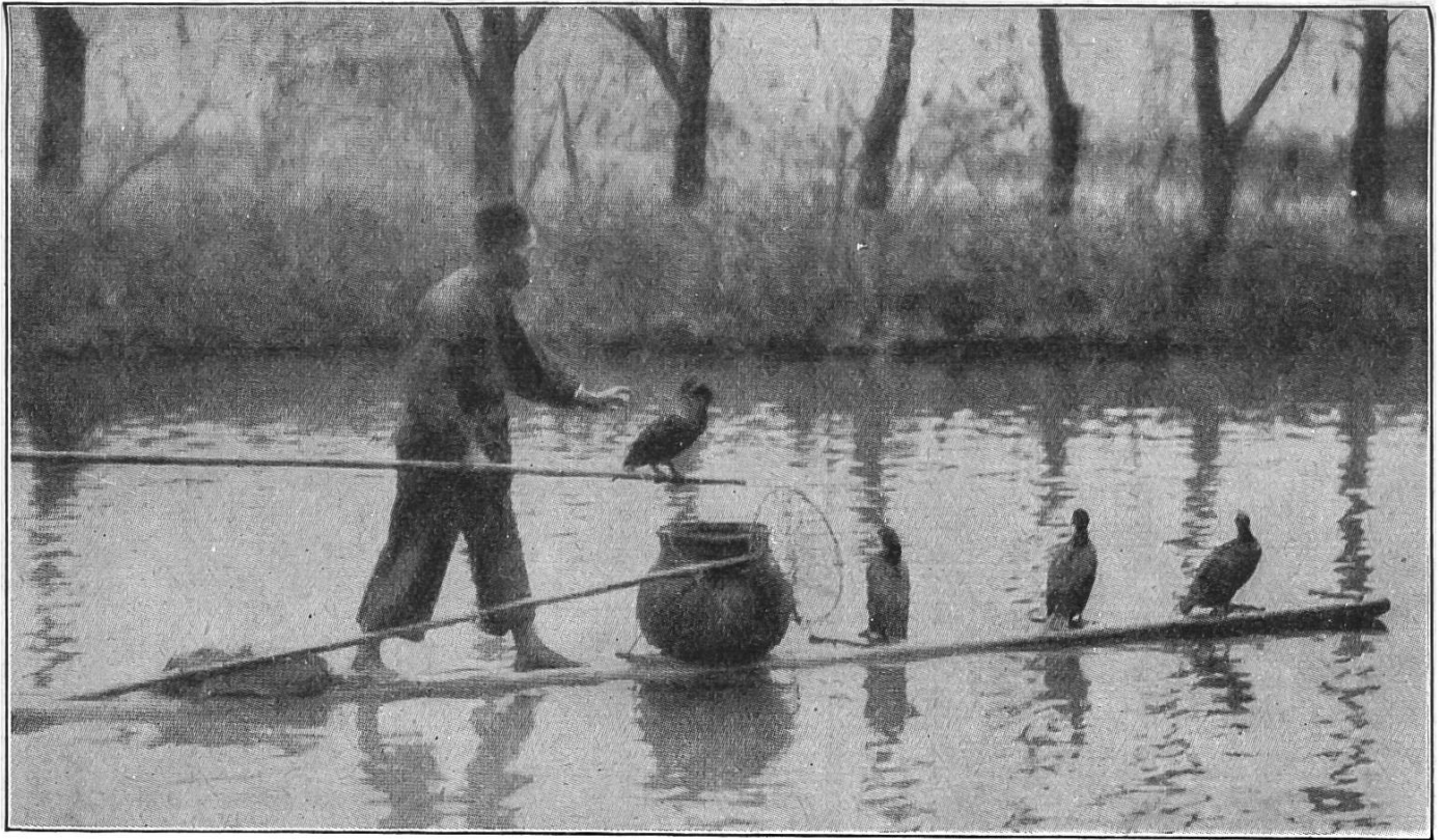
Der Fischer hebt den Kormoran, der einen Fisch gefangen hat, mit der Stange aus dem Wasser.