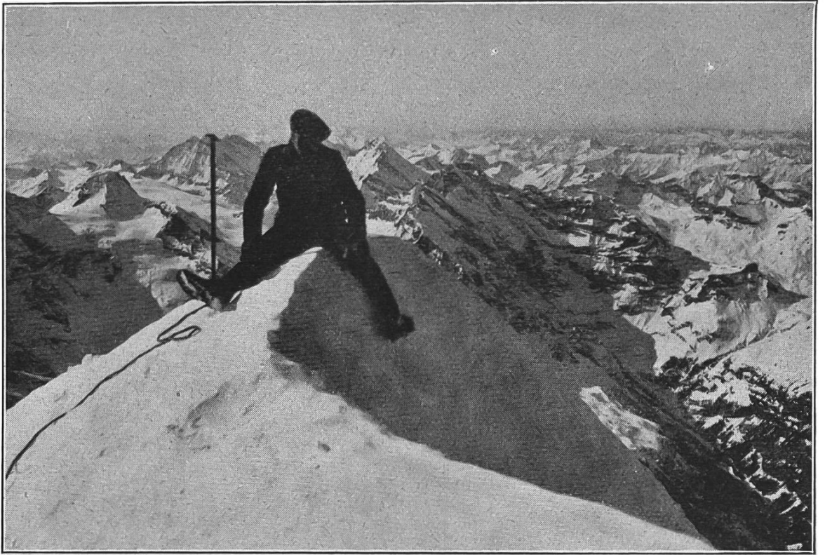
Auf dem Jung- fraugipfel, 4166m.