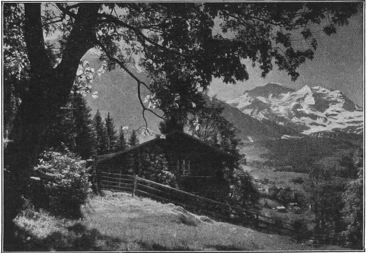
Bei Wengen. Blick gegen die Jungfrau.