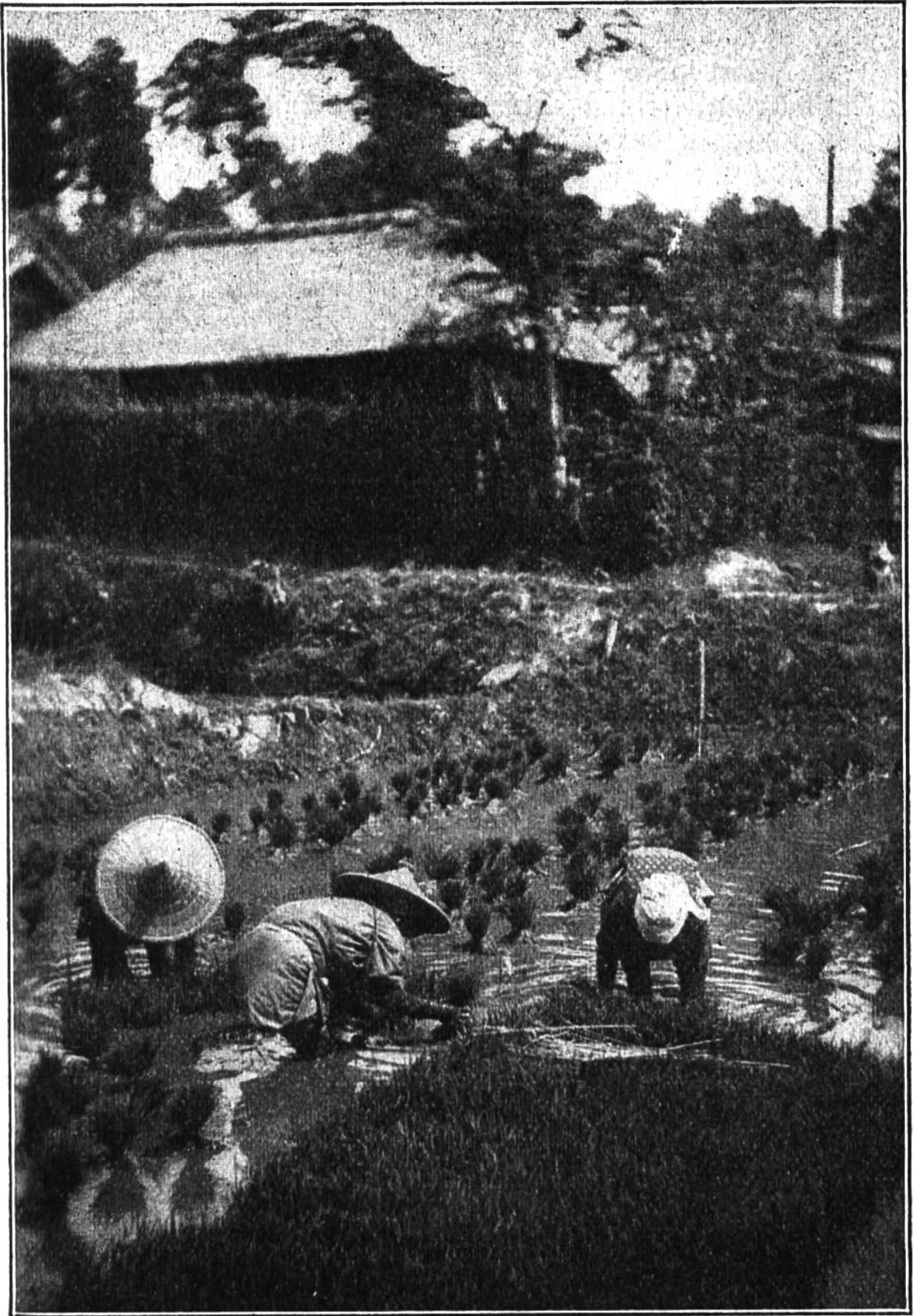
Oft wird der Reis zuvor in Beete gesetzt und erst nachdem die Pflanze eine gewisse Größe erreicht hat in die Felder verpflanzt.