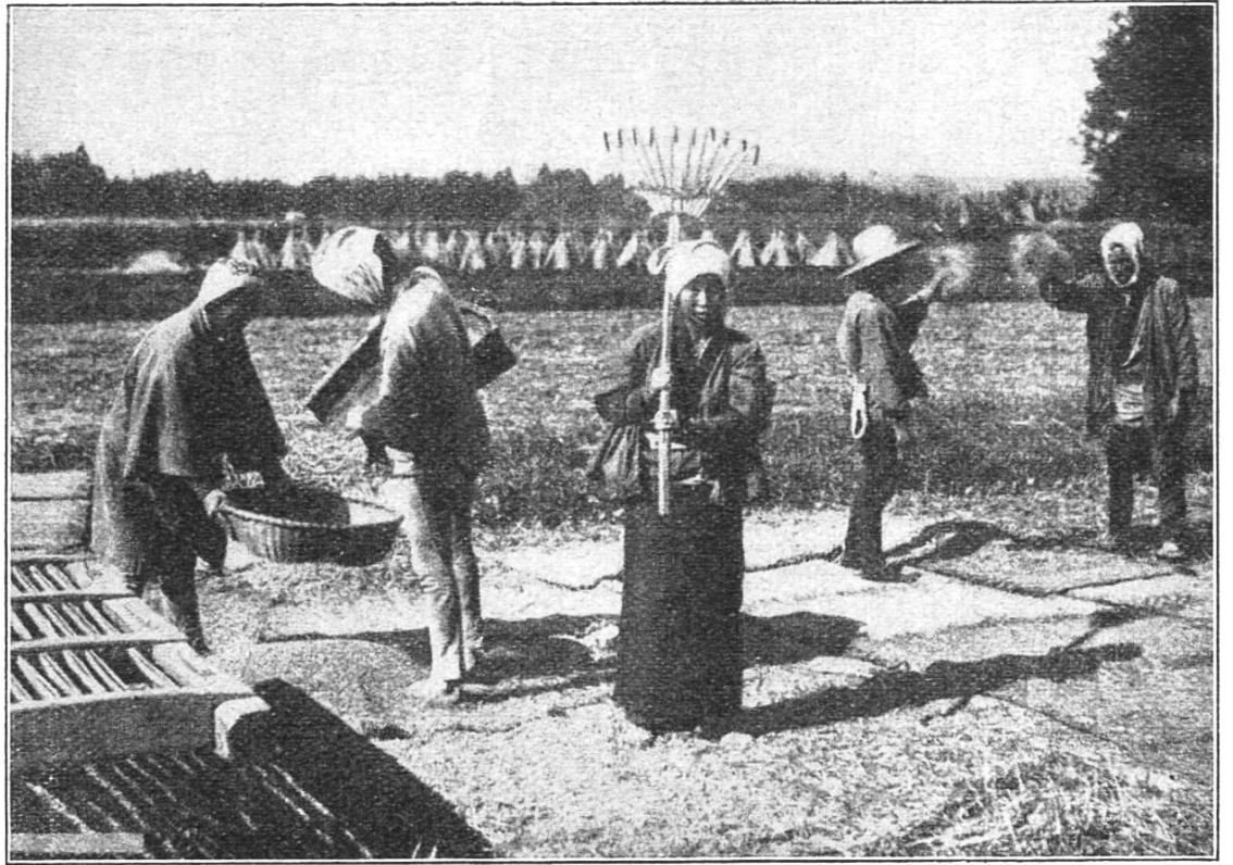
Wie der Reis in Japan gedroschen und gesiebt wird.