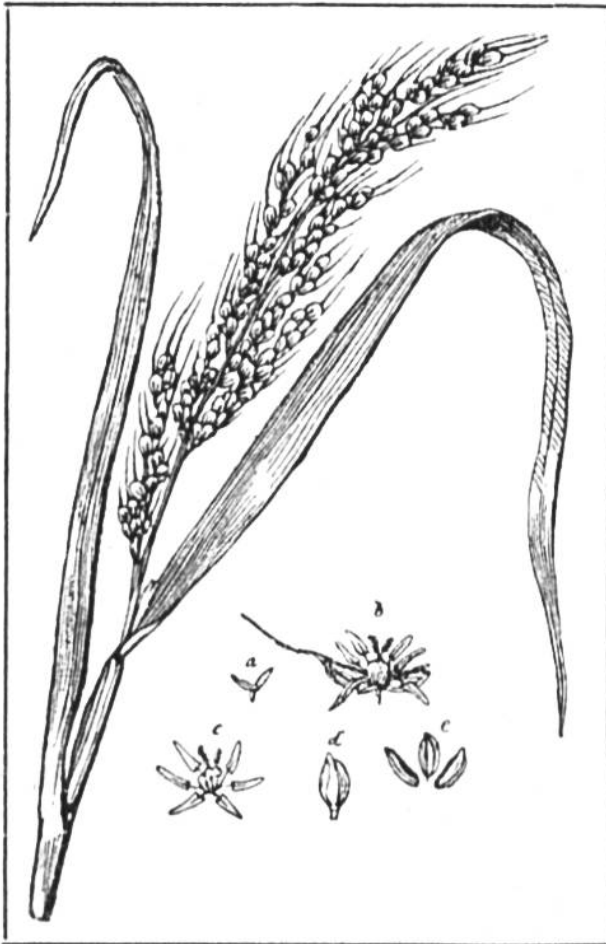
Rispe der Reispflanze.

bestimmten Tage des Jahres in feierlicher Weise aus. Es steht heute fest, daß die Reispflanze zu den ältesten Kulturgewächsen Chinas und des indisch-malaiischen Gebietes gehört. Zweifelhaft ist jedoch, ob Ostasien auch ihre Heimat darstellt; wildwachsender Reis ist in China nicht gefunden worden, in Ostindien und Zentralafrika trifft man ihn überall an. Der wildwachsende Reis soll an Wohlgeschmack den angebauten Reis noch übertreffen.