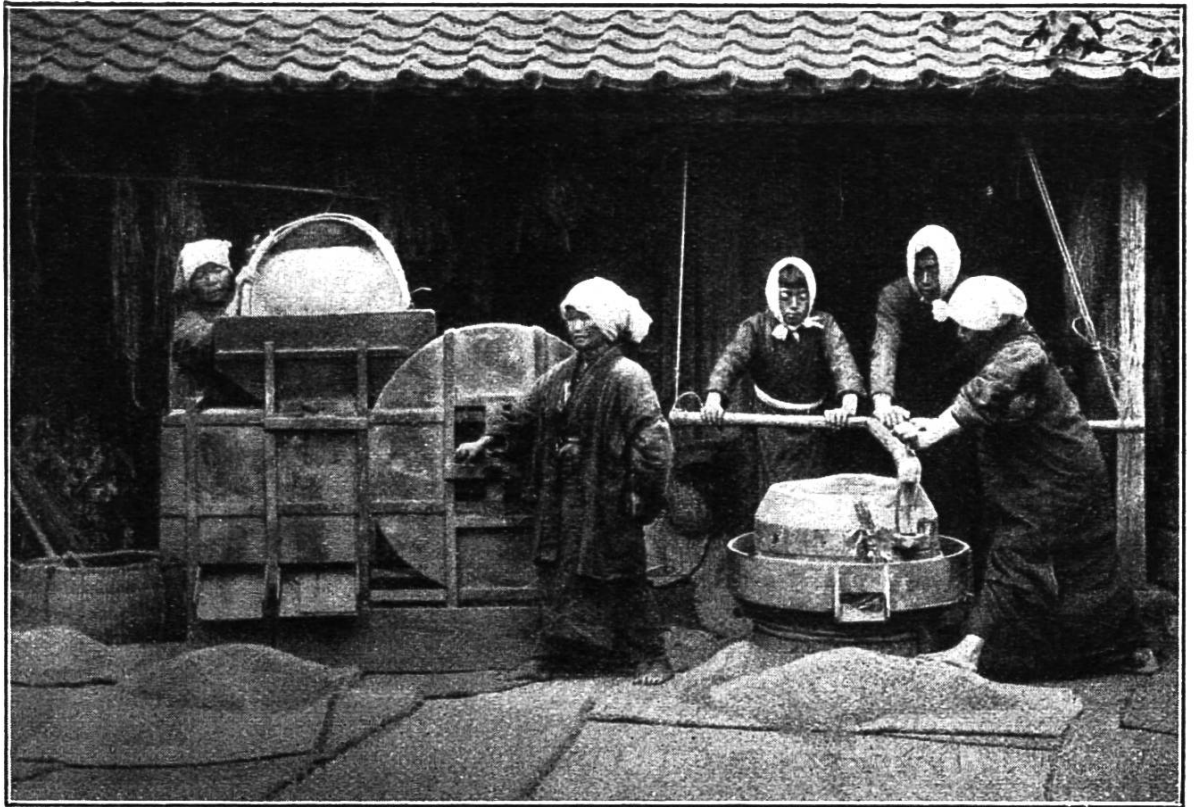
Der Reis wird in Mühlen mit hand- betrieb geschält und gereinigt.