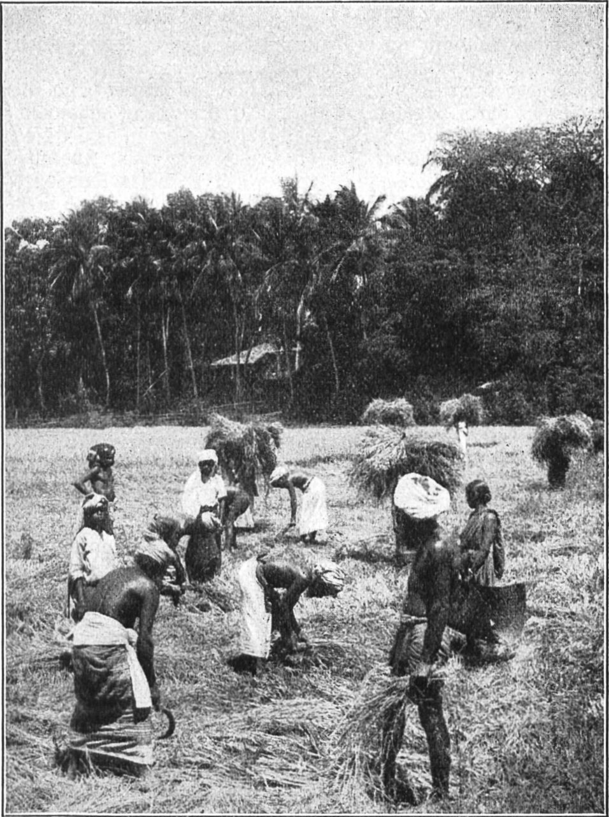
Reisernte auf der Insel Ceylon.