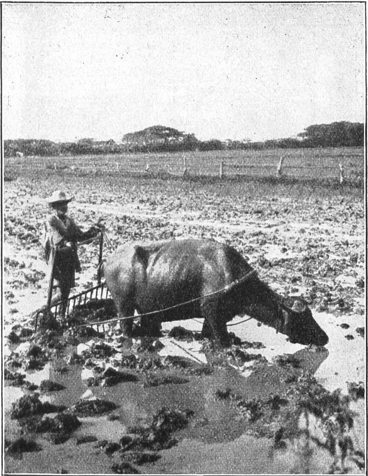
Sür Mensch und Tier beschwerlich ist das Arbeiten im überschwemmten Reisfelde.