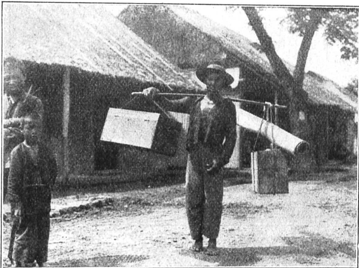
Chineser auf Reisen. Den Koffertransport hat dieser Mann, der gewohnt ist, sich auf eigene Kraft zu verlassen, in einfacher Weise gelöst.

Unsere Zubereitungsarten des Reises sind bekannt. In der Industrie findet der Reis Verwendung als Zusatz zu Waschpulvern und als Stärkeersatz. Zur Herstellung des Bieres wird ebenfalls viel Reis benutzt. Die Abfälle beim Polieren des Reises (Schalenreste und zerbrochene Körner) dienen zum Füttern und Mästen des Viehs. Stengel und Stroh der Reispflanze werden zu Geflechten benutzt und lassen sich auch in der Papierfabrikation verwenden. Von den verschiedenen Handelsorten gilt der in den Südstaaten der Union angebaute Karolina-Reis als der vorzüglichste; sehr geschätzt ist auch der Java-Reis. Bengal- und Patna-Reis sind die beiden Hauptsorten Indiens. In der Einfuhr von Kolonialwaren nach der Schweiz kommt der Reis nach Zucker gleich an zweiter Stelle. Im Jahre 1921 wurden 151,486 Zentner im Werte von 8,305,000 Franken in unser Land eingeführt. Davon stammte der größte Teil aus Spanien und Italien, der Rest aus Süd- und Nordamerika (Karolina).