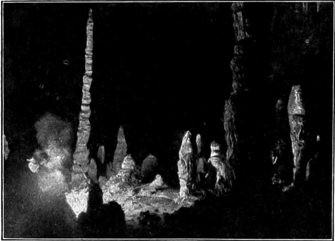
Eine Gruppe monumentähnlicher „Stalagmiten“, einzelne erheben sich in nadelschlanker Form bis zu 16 Meter Höhe.

gleichen Burgen, Türmen und Minaretten von fremdartigem Bau; andere wieder erscheinen wie vorsündflutliche Eichen und fabelhafte Riesentiere. Da und dort haben sich die von der Decke hängenden „Stalaktiten“ und die vom Boden aufsteigenden „Stalagmiten“ zu gewaltigen Säulen vereinigt, die wie in einem Dome das weite Gewölbe zu tragen scheinen. Erleuchtet Magnesiumlicht den Raum, so erblickt das Auge mehr des Wunderbaren als die kühnste Phantasie sich je erträumte.