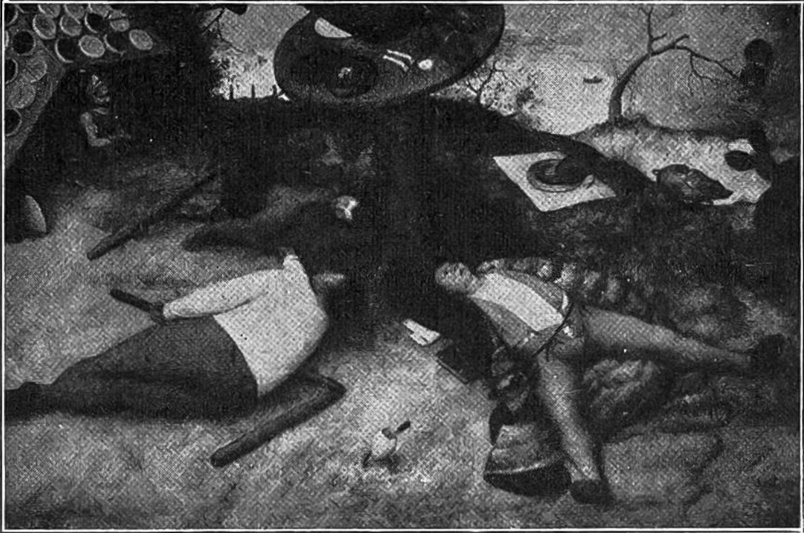
Das Schlaraffenland. Gemälde d. holländischen Malers Peter Brueghel. Soldat, Bauer u. Städter ruhen sich unter dem „Tischleindeckdich“ aus.