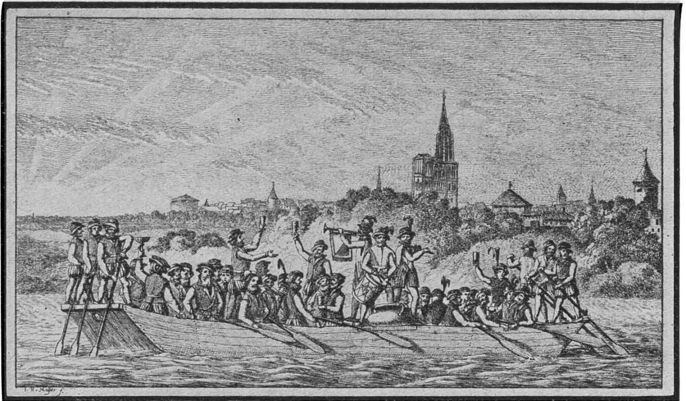
Ankunft einer Gruppe von Zürichern in Strassburg zum grossen Wettschiessen vom Jahre 1576. Um der Stadt Strassburg, die mit den Eidgenossen verbündet war, zu zeigen, wie schnell in Stunden der Gefahr Freundeshilfe zur Stelle wäre, fuhren die Zürcher in einem Tag nach Strassburg. Ein Topf mit Hirsebrei, den man in Zürich heiss aufs Schiff verladen hatte, war bei der Landung am Ziel noch nicht erkaltet. (Nach einem alten Stich.)