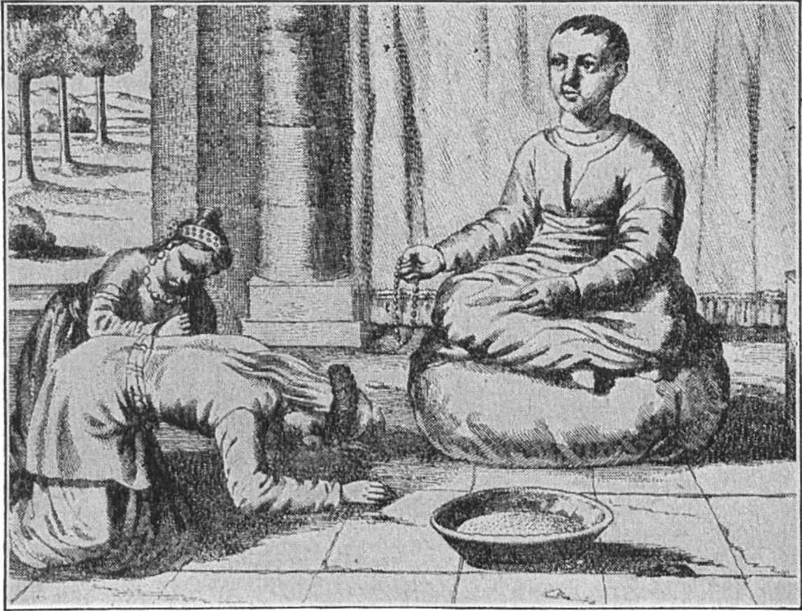
Gläubige Buddhisten vor ihrem obersten Priester, dem Dalai Lama zu Lhasa.