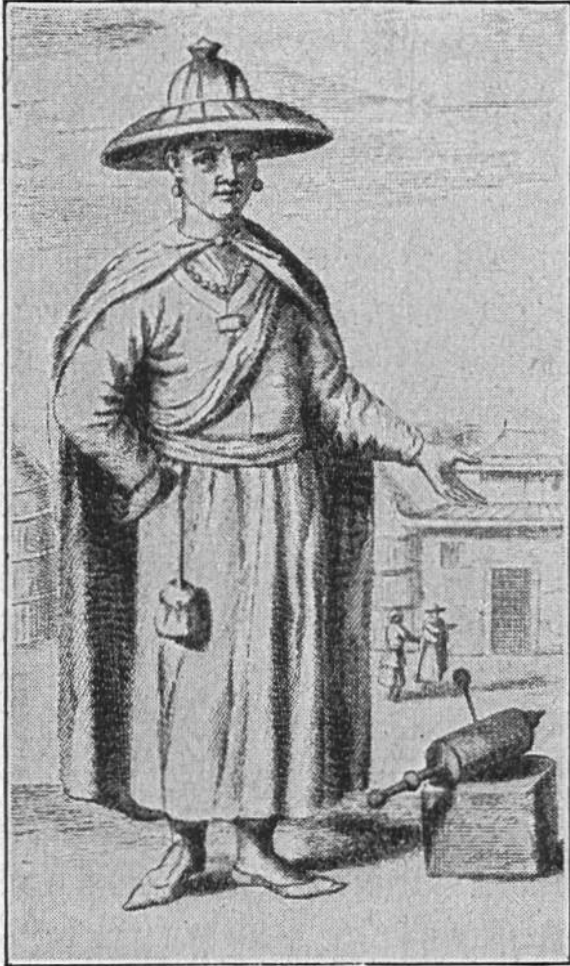
Tibetanischer Priester mit der Gebetsmühle, einem um eine Achse drehbaren Zylinder, der Zettel mit Gebetsformeln enthält.

scharen, die Lhasa alljährlich aufsuchen, den seltsamen religiösen Gebräuchen der Tibetaner, aber leider hat er keine zusammenhängende Schilderung seiner unglaublich kühnen Reise geliefert. Dafür verdanken wir ihm Zeichnungen von Bewohnern des Landes und gar von der grossartigen, burgähnlich auf dem Berge Potala gebauten Residenz des Dalai Lama. Wir bringen Wiedergaben seiner Bilder, wie sie sich in Kupfer gestochen im Buch über China eines seiner Ordensgenossen finden. Vergleiche mit modernen Photographien ergeben eine