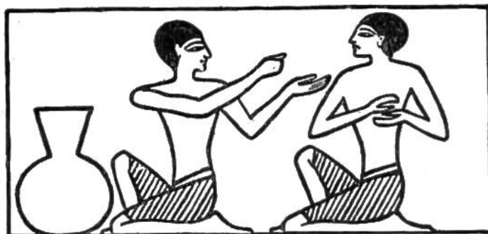
Grad- und Ungrad-Spieler. (Die Bilder sind nach Darstellungen in alt-ägyptischen Grabkammern gezeichnet.)

gen nicht zu verzichten brauchten. Über die Regeln und den Verlauf der Brettspiele wissen wir leider nichts. Aus Bildern auf den Wänden von Grabkammern jedoch ist zu ersehen, dass es verschiedene Arten von Brettspielen gegeben haben muss. Bei dem einen schob man Steine, die zum Teil den Bauern unseres Schachspiels gleichen, auf dem in Felder eingeteilten Brett. Für das andere bedienten sich die Spieler einer runden Tafel, die einen Griff hatte. Auf der Tafel waren Kreise zu schlangenhaften