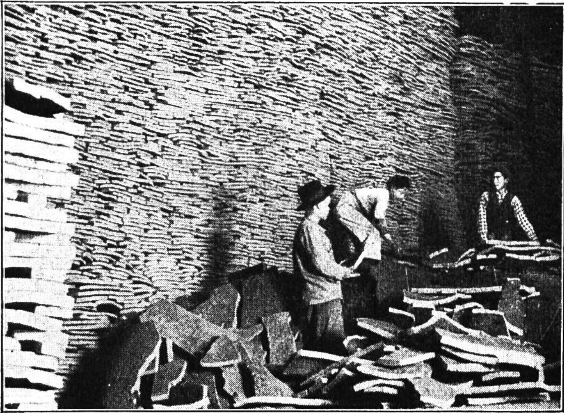
Riesenlager einer portugiesischen Korkfaktorei.

Bei der Herstellung der Zapfen geht etwas mehr als die Hälfte des Korkmaterials verloren. Indes gibt es auch für diese Abfälle noch eine nützliche Verwertung. Die Linoleumindustrie bedarf grosser Korkmassen. Zu Platten gepresst finden Korkstücke auch als Isoliermassen, mit denen z. B. Dampfrohre überzogen werden, Verwendung. Von den vielfältigen Ausnutzungsmöglichkeiten des Korks muss zum mindesten noch die Herstellung von Schwimm- und Rettungsgürteln erwähnt werden.