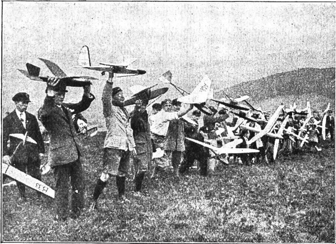
Mit den Modell-Segelflugzeugen zum Start.