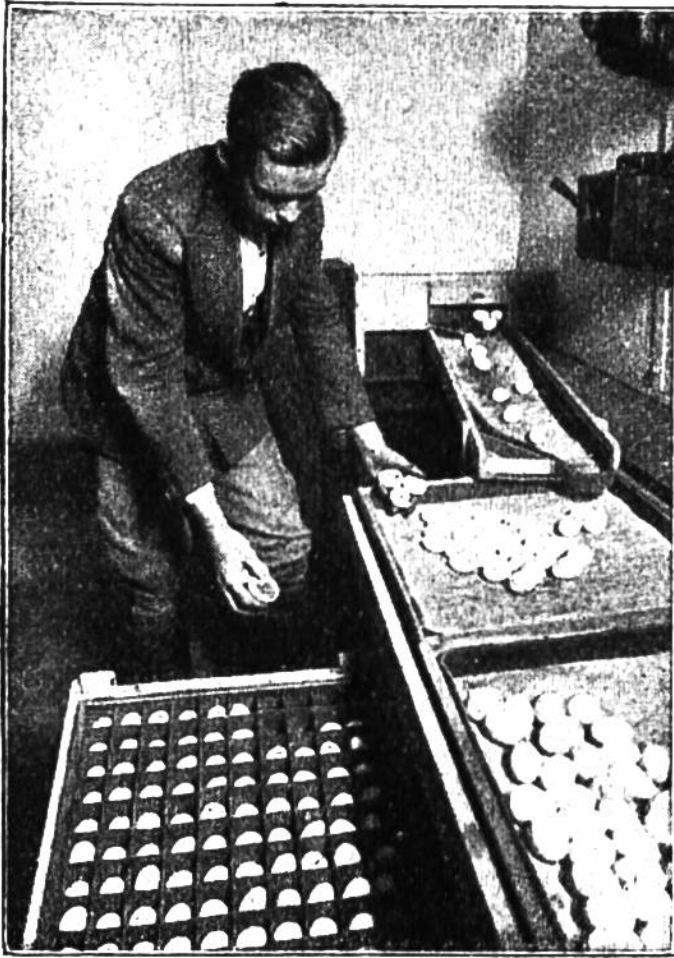
Die Eier werden vom laufenden Band weg sortiert.

und Tränkegeschirre sind derart eingerichtet, dass sie nicht verunreinigt werden können. Sie geben stets nur soviel von ihrem Inhalt ab, als vorweg „konsumiert“ wird. Rings an den Wänden sind Legenester angebracht, kleine Zellen, in denen nur je eine Henne Platz findet. Ist die Zelle besetzt, so klappt die Türe zu. Ist das Ei gelegt, so nimmt der Kontrollbeamte die Henne wieder heraus. Während ein Huhn für gewöhn-