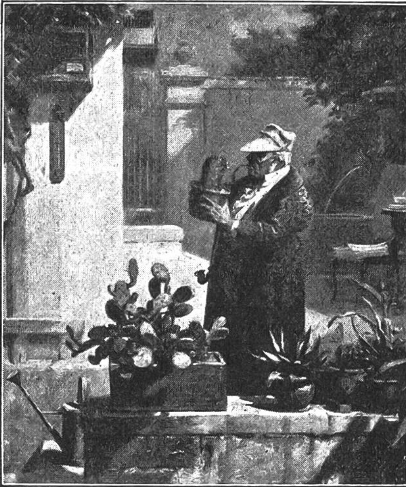
Der Kakteen- freund, von Karl Spitzweg (1808 bis 1885).

dienlicher. Sie bieten einen gewissen Schutz gegen Tiere, denen die saftreichen Gewächse in den Gebieten, wo der Durst herrscht, wohl munden würden. Zwar suchen Esel und Rind die Kakteen zu entwurzeln, um von der unbewehrten Seite an die saftigen Gewebe zu gelangen. Oder sie versuchen durch Hufschläge die Pflanze zu spalten, tragen aber oft genug unangenehme Verwundungen davon. Um die Kakteen als Viehfutter verwenden zu können und die Früchte (besonders der Feigenkakteen) zu geniessen, hat der Amerikaner aber auch stachellose Kakteen gezüchtet. Damit können weite, bisher öde Gebiete für die Landwirtschaft erschlossen werden.