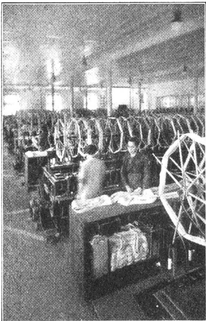
Blick in den grossen Saal der Schuss-Spulerei. Hier werden die gesponnenen Flachsfäden von den Strangen auf kleine Holzspulen gehaspelt. (Leinenwebereien Worb & Scheitlin, Burgdorf.)

auch im Kanton Bern spann und wob man den Flachs zu sehr geschätztem „Emmenthaler Linnen“. Im 18. Jahrhundert wurde der Leinwandhandel in St. Gallen durch die neu aufkommende Baumwollindustrie verdrängt, die sich im 19. Jahrhundert zur Stickerei entwickelte. Die bernische Leinenweberei gewann jedoch an Bedeutung; überall wurden mechanische Webereien errichtet, so dass heute die bernischen Leinenwarenfabriken die bedeutendsten dieser Art in der Schweiz sind. Für die Herstellung