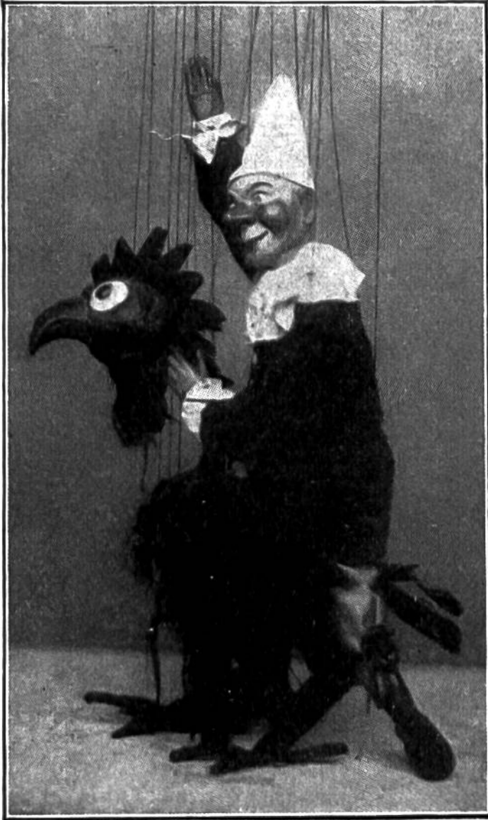
Eine Figur aus dem bekanntesten deutschen Volkspuppenspiel ‚Dr. Faust‘.

oft werden auch augenblicklich erdachte Spässe eingeflochten. In neuerer Zeit wird viel nach gedruckten Texten gespielt, aber die alte Art ist ursprünglicher und volkstümlicher. Beim Puppenspiel gibt es kein Umkleiden, wie beim grossen Theater, und deshalb braucht es zu Aufführungen sehr viele Figuren. Bei den Handpuppen stehen die Marionettendirektoren unter der Bühne; die Hand ihres ausgestreckten Armes befindet sich im Körper der Puppe und bewegt sie. Bei den Drahtpuppen ist