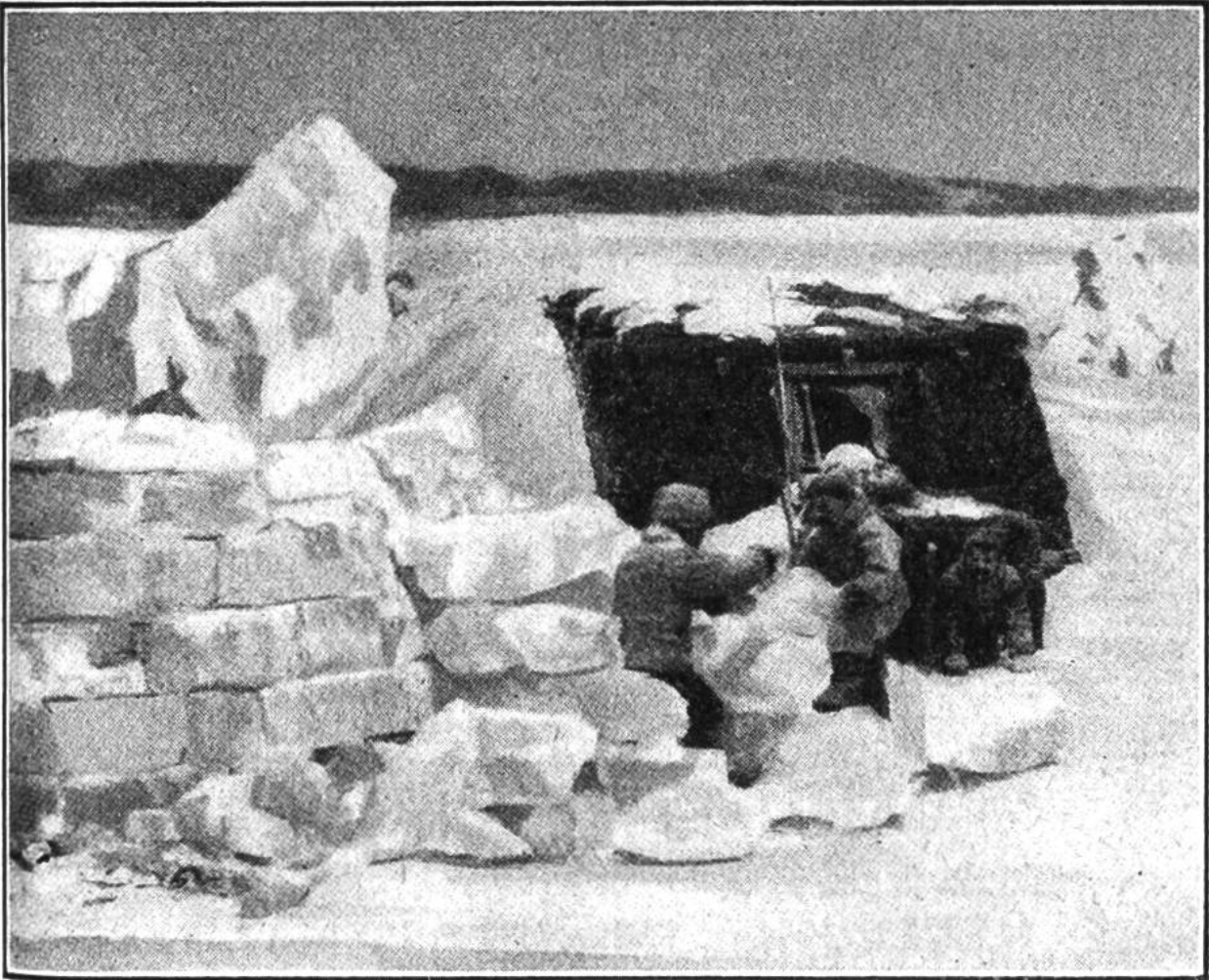
Neben der Sommerhütte bauen Eskimos eine wärmere Winterhütte aus Eisblöcken.

durch das Wasser gleiten, hört man kein Geräusch, weder von den Rudern noch vom Kiel, der das Wasser durchfurcht. Die auf treibenden Eisschollen sich sonnenden Seehunde wittern keine Gefahr; sie werden mit der selbstgefertigten Harpune oder neuerdings auch mit dem Gewehr erlegt. Die Eskimos könnten ohne Seehundsjagd kaum ihr Leben fristen. Sie verwenden das Fleisch, die Felle und den Tran der Seehunde. Zur Herstellung von Gebrauchsgegenständen dienen Därme, Sehnen und Knochen. Allerdings erlegen die Eskimos auch Walrosse, Eisbären, Wale und Polarfüchse, zudem fangen sie Fische, aber die Jagd auf Seehunde ist bei weitem am ergiebigsten. Die Eskimos verkaufen auch Seehundsfelle, die dann in verschiedener Art verarbeitet werden; dem Skifahrer sind sie nicht unbekannt.