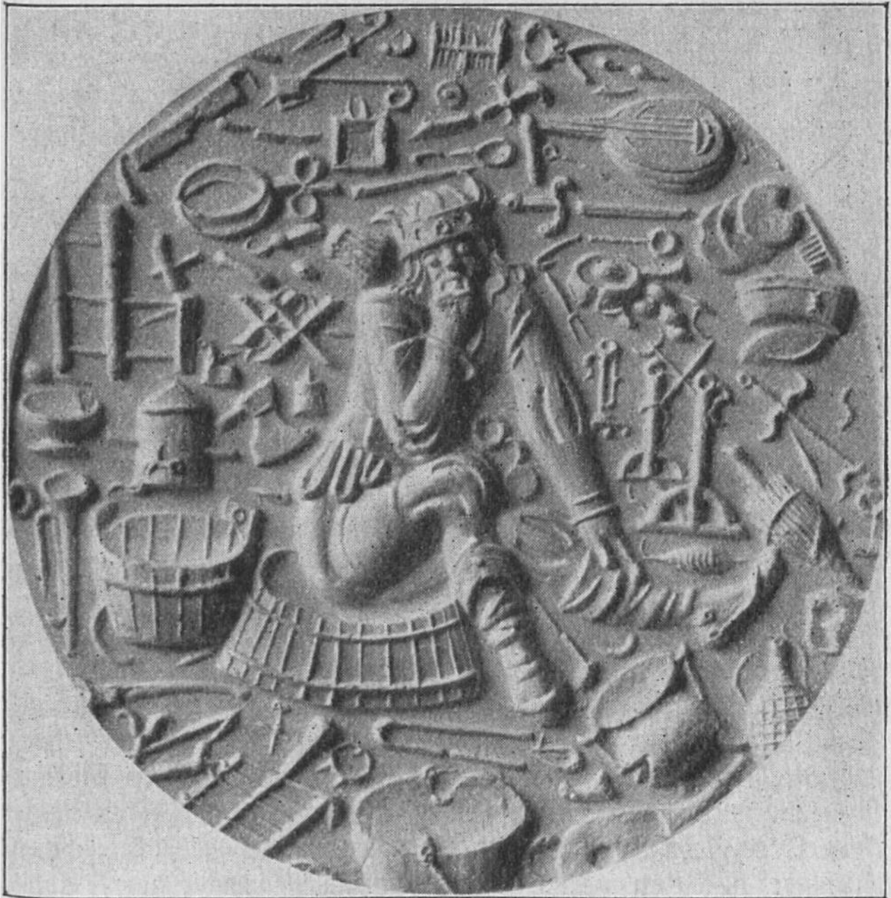
Alte Darstellung des „Niemand“ inmitten von Gegenständen, die er zerbrochen haben soll.