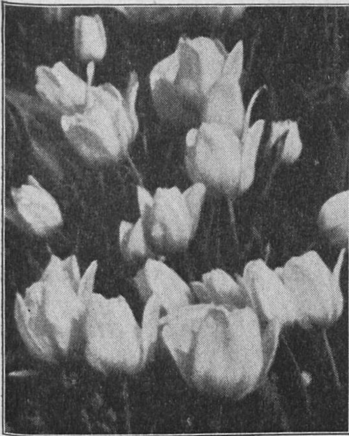
Einige Prachtsexemplare edel geformter Tulpen.

Mittelpunkt für die Zucht der Zwiebelgewächse ist Haarlem, während die 6000 Bewohner von Aalsmeer, fast ausschliesslich Gärtner, hauptsächlich Schnittblumen ziehen. Aus ganz Europa kommen die Blumenhändler zu den grossen Blumenversteigerungen, die in einer besondern Blumenbörse stattfinden.