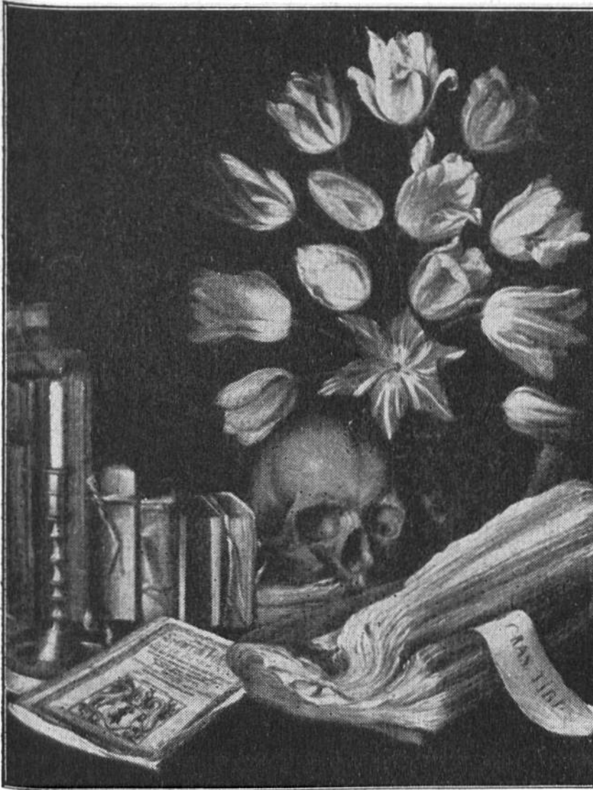
Bild des bernischen Malers Albrecht Kauw aus dem Jahr 1649. Der prächtige Tulpenstrauss rechts zeigt, dass die Tulpenfreudigkeit damals auch in der Schweiz herrschte. Das Stilleben ist ein Sinnbild der Vergänglichkeit.