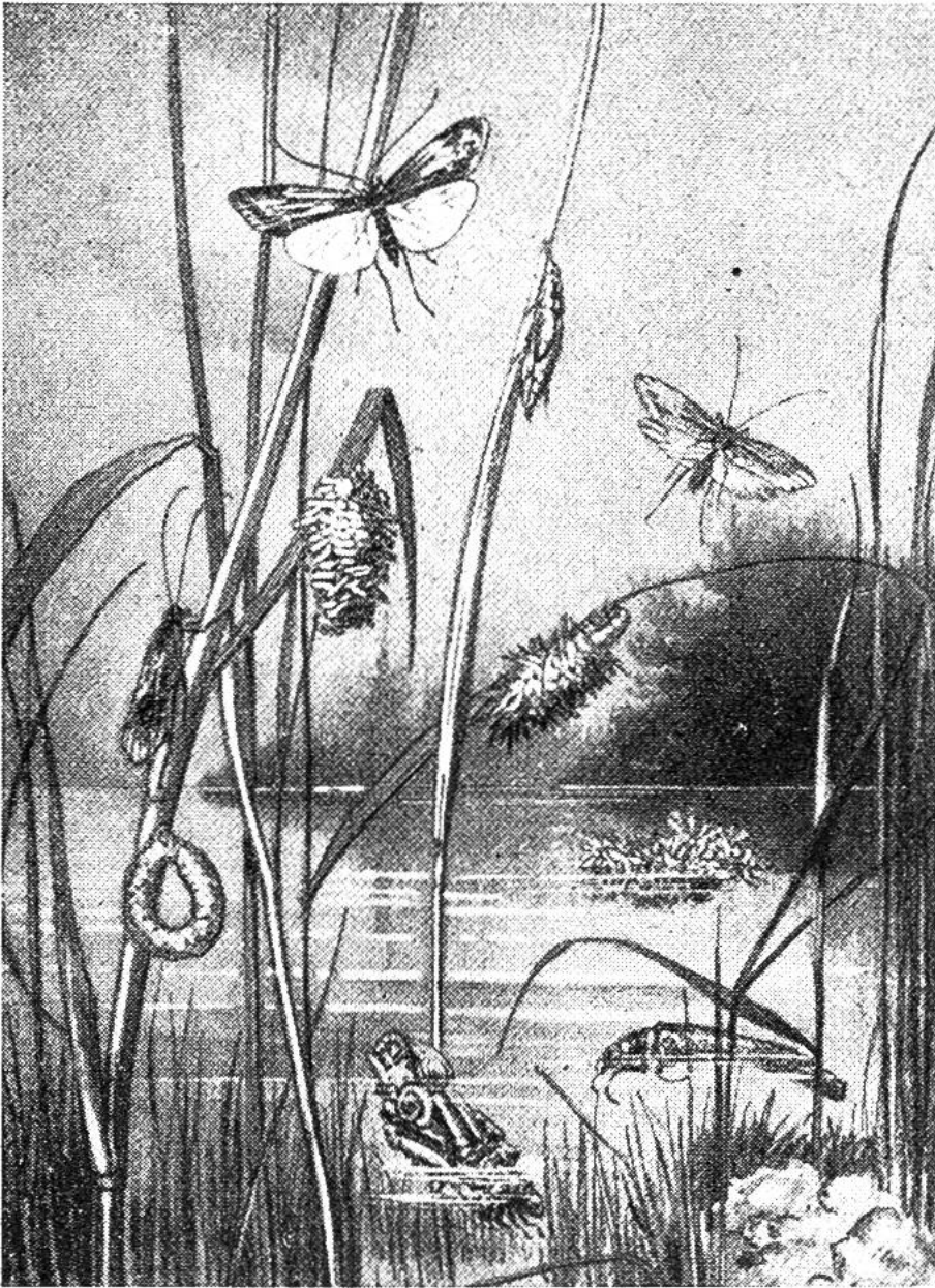
Entwicklung der Köcherfliegen. Ringförmiger Laich, Larvengehäuse, Puppe und fliegende Köcherfliegen.