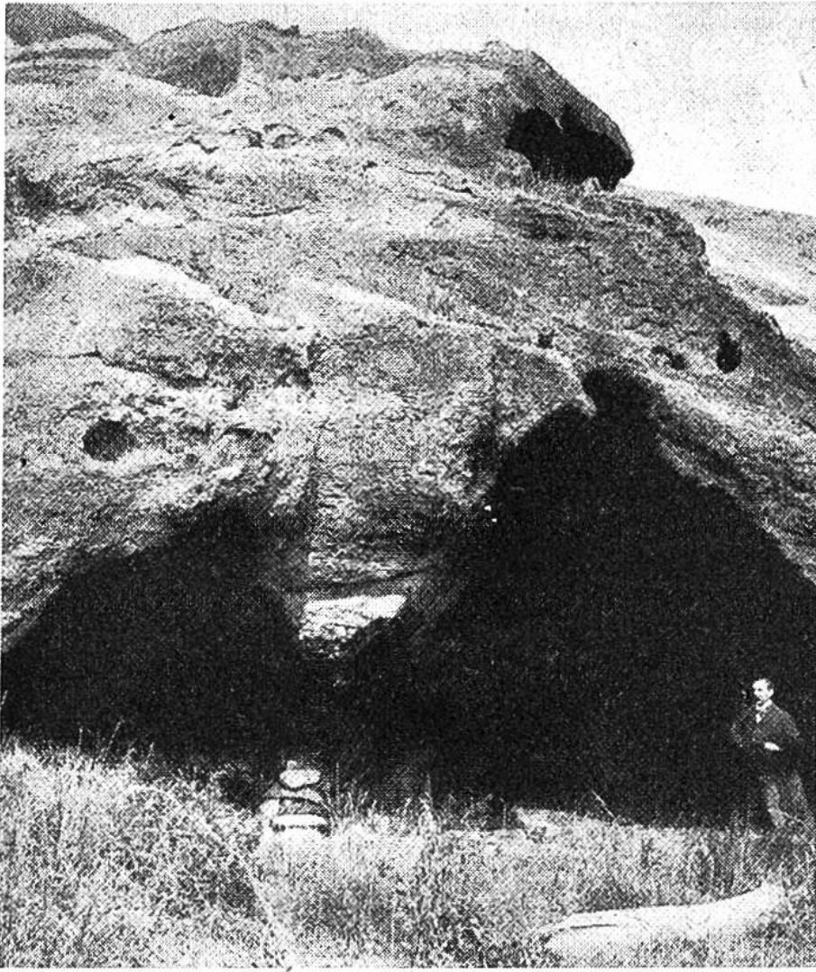
Diese Höhle war Selkirks Wohnung. Über vier Jahre musste er hier ausharren, allein auf sich angewiesen, allen Fährnissen trotzend.