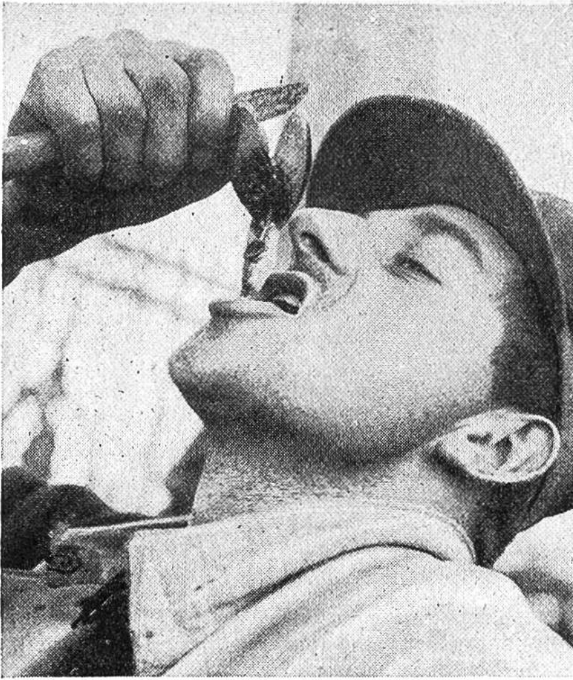
Eine Kostprobe! Der Fischer prüft die Qualität seiner geernteten Muscheln.