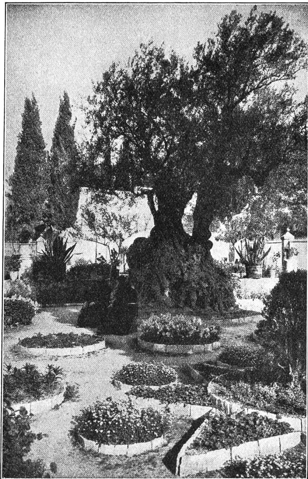
Der Garten Gethsemane, wo Jesus Christus in der Nacht vor seiner Gefangennahme ruhte.