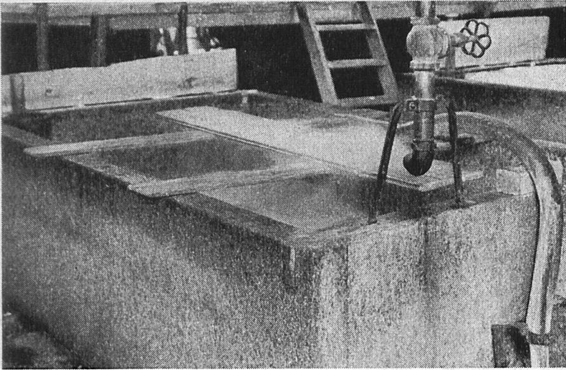
Die gereinigte und entfettete Baumwolle kommt zum Bleichen mittels Säuren in grosse Granittröge.