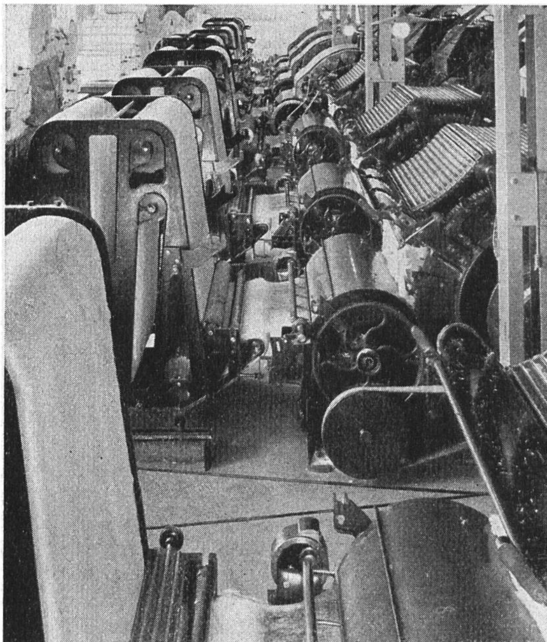
Kardiermaschinen. Hier entsteht die fertige Watte.

Versetzen wir uns zur Erntezeit nach Indien oder in den Staat Louisiana (USA), wo sich unter tropischer Sonne unübersehbar die Baumwollfelder ausdehnen. Die Baumwollernte ist der kostspieligste Teil der Baumwollkultur. Die Samen reifen verschieden rasch, und die darin enthaltenen Fasern sind nur dann für die Verwertung geeignet, wenn sie sofort nach dem Aufspringen der Kapseln gepflückt werden. Während 2—4 Monaten durchschreiten Scharen von Eingeborenen jeden Morgen bei Tagesanbruch die Pflanzungen, um die reife Baumwolle zu pflücken.