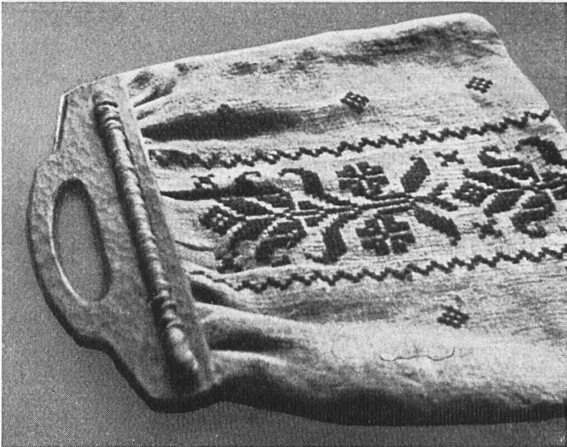
Einkaufstasche mit geschnitzten Holzbügeln.

Schlitz des Bügels und steckt einen Stab von 26 cm Länge und 0,6 cm Breite hindurch. Da der Stab länger und zusammen mit dem Stoff dicker ist als der Schlitz, hält er die Tasche fest. Diese Befestigungsart gestattet ein müheloses Anbringen und Entfernen der Bügel, was sehr vorteilhaft ist. Es kommen folgende Holzarten in Frage: Nussbaum, Ulme, Apfel- oder Birnbaum, Erle, Ahorn, Buche.