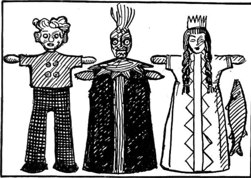
Kasper, Zauberer, Prinzessin u. Fisch; die Figuren für das nachfolgende Stück 'Chaschper am See'

Dann kommt das Bemalen an die Reihe. Wir verwenden dazu am besten Plakatarben. Zuerst übermalen wir den ganzen Kopf in der gewünschten Hautfarbe. Selbstverständlich ist sie nicht für alle Kasperli die gleiche, für eine Prinzessin etwa zartrosa, den Kasperli orange, den Zauberer feuerrot oder grün. Ist die Grundfarbe gut trocken, so malen wir Augen und Mund auf. Auch da ist es nicht ganz gleichgültig, ob wir die Augen blau oder schwarz, gross oder klein, rund oder länglich machen. Form und Farbe von Augen und Mund tragen viel zum Gesichtsausdruck bei. Ist das Gesicht gut trocken, so überstreichen wir es mit Spirituslack; dadurch werden die Farben haltbar. Als Haare kleben wir Wollfäden auf. Es ist ein richtiger Genuss und Späss, für jede Figur eine andere Frisur zu erfinden.