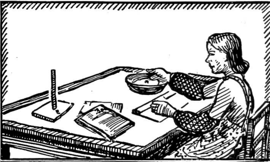
Aus Papier und Kleister werden die Köpfe der Kasperpuppen hergestellt.