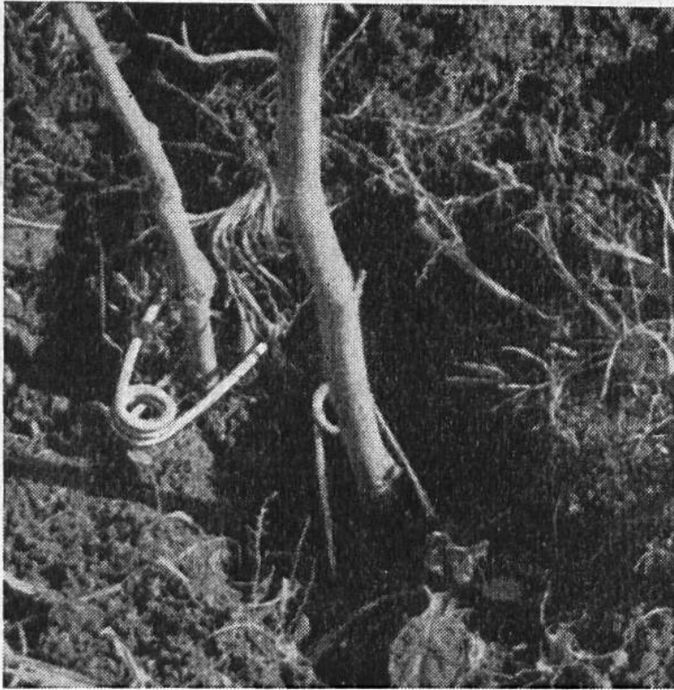
Zwei Fallen, in Maulwurfsgänge eingeführt und durch eingesteckte Ruten befestigt.

tieren gehört, stellt der Maulwurf (irrtümlich zuweilen auch als Schermaus bezeichnet) einen Insektenfresser dar, also einen nahen Verwandten der Spitzmaus und des Igels. Wegen der weitgehenden Übereinstimmung in der unterirdischen Lebensweise der beiden sonst so ungleichen Tiere können sie vom Schermauser mit denselben Instru-