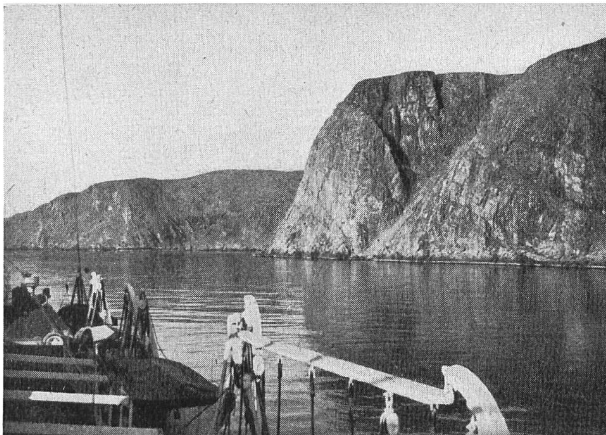
Der Touristendampfer fährt in die Hornsvikenbucht am Nordkap ein, das im Juni und Juli ein beliebtes Ausflugsziel bildet.

übrigen Europa überhaupt so weit in den Norden gelangt, ist froh, von der nördlichsten Stadt Hammerfest aus auf einem Küstenfahrtschiff das Nordkap erreichen zu können, das einen eindrucksvollen Bergvorsprung der norwegischen Insel Magerö darstellt.