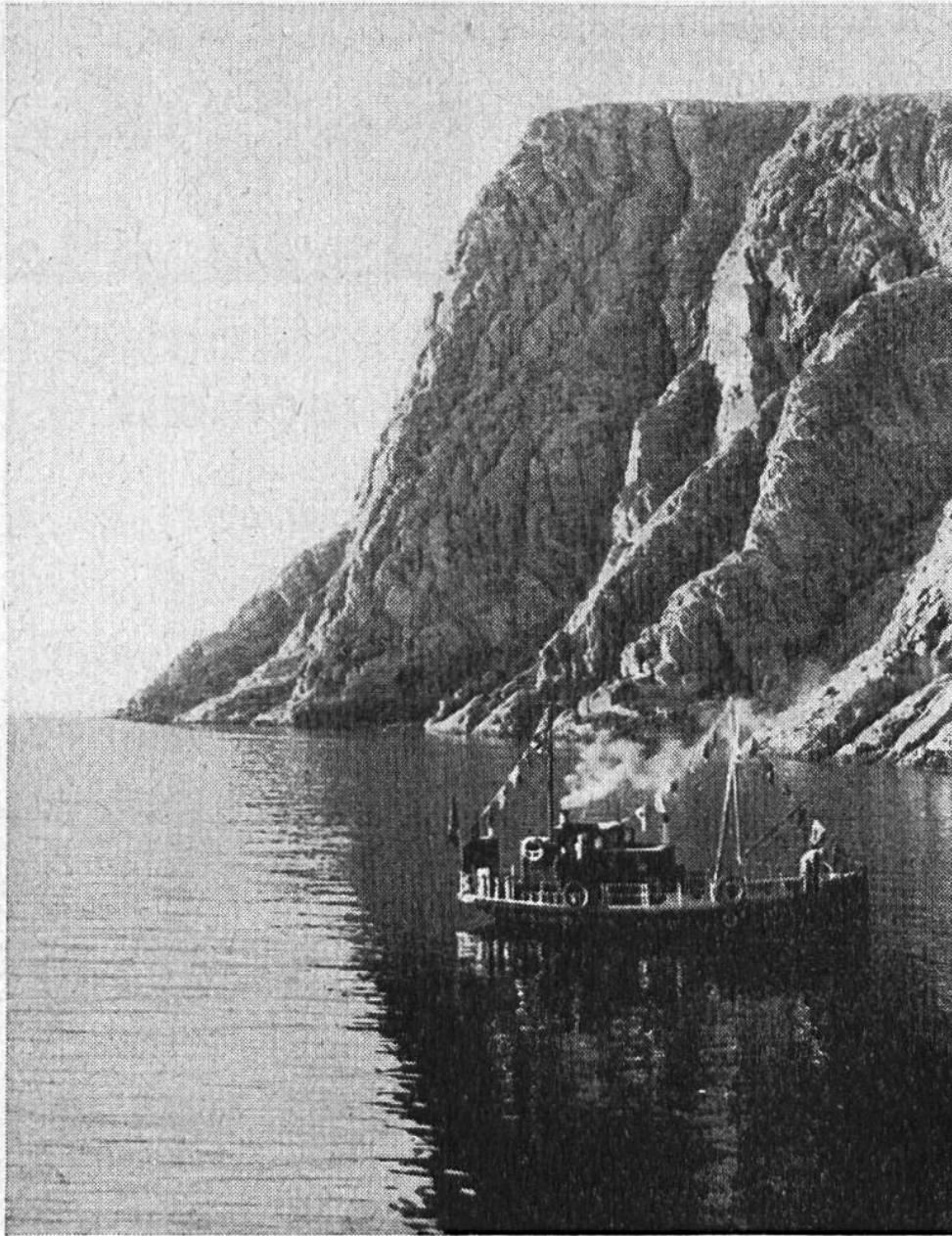
Ein Fischerkutter kehrt nach einer

der winzigen Siedlungen zurück, die am Fusse des Nordkaps liegen.