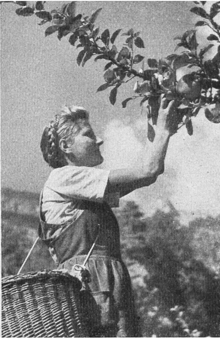
Der Gärtnere- innenberuf ist ein an- strengender, aber ide- aler Mädchenberuf.

lichen Abteilung der Eidgenössischen Technischen Hochschule vor. Nach erfolgreich bestandem Hochschulexamen hat er vielseitige Betätigungsmöglichkeiten.