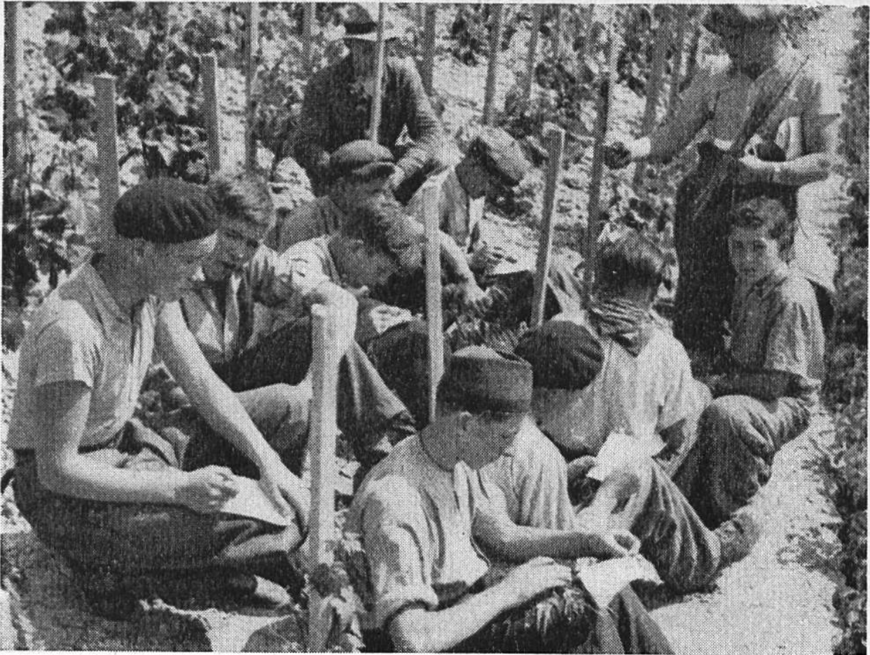
Landwirtschaftsschüler einer westschweizerischen Fachschule werden im Weinbau unterwiesen.