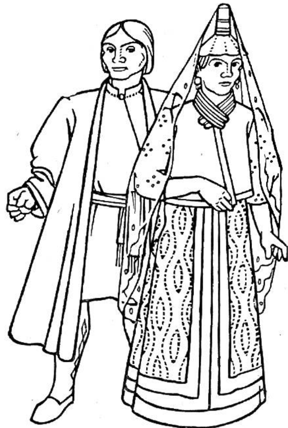
Tracht der Bojaren (russische Adlige) um 1600.