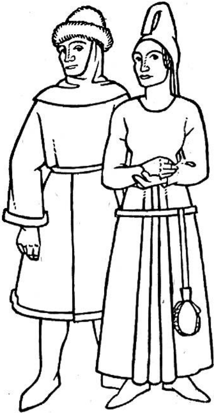
Kleidung der Normannen im 13. und 14. Jahrhundert.