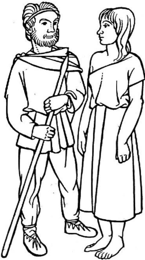
Kleidung der Germanen zur Römerzeit, 2. Jahrhundert n. Chr.