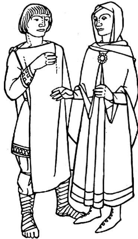
Tracht der Franken zur merowingischkarolingischen Zeit, 7.–9. Jahrhundert.