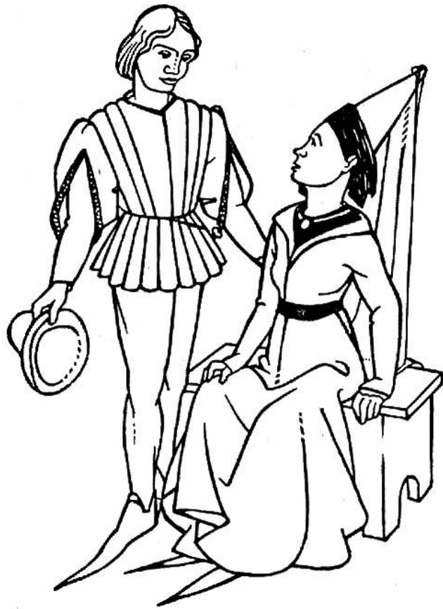
Burgundische Mode, 1470.