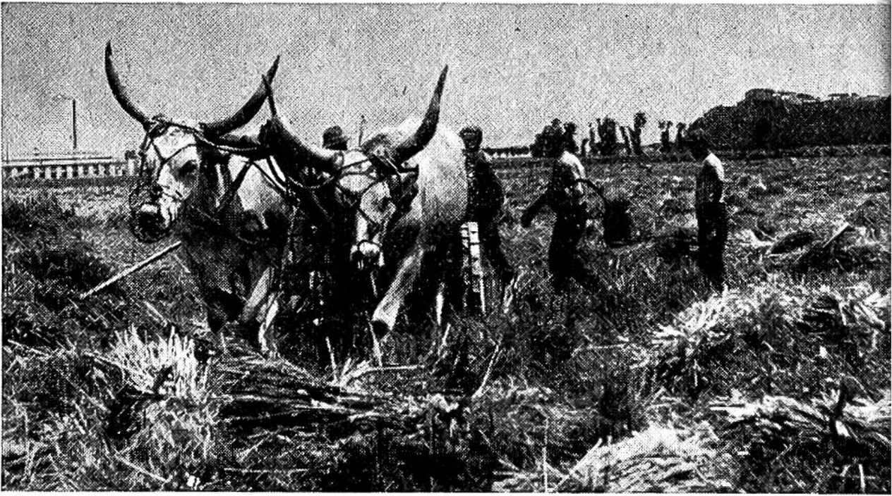
Reisernte in Italien. Die mächtigen Ochsen der Romagnola-Rasse ziehen einen modernen Bindemäher.

In der Lombardei erntet man den Reis, wie bei uns das Getreide, mit der Sense oder mit dem Bindemäher im Nachsommer. Auch das Trocknen, Einführen, Aufstocken und Dreschen unterscheiden sich nur wenig von der Behandlung unseres Brotgetreides.