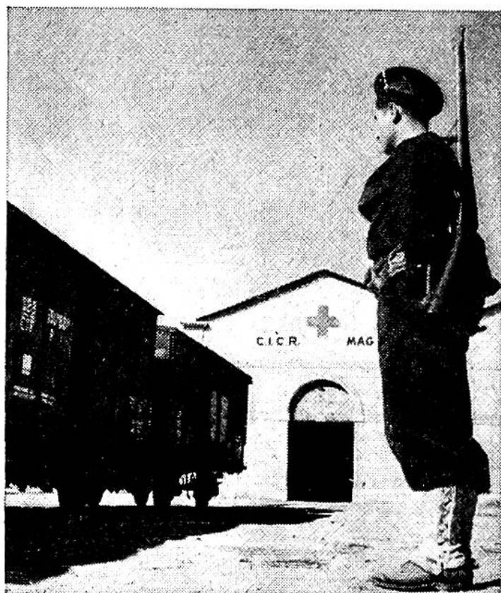
Ein Soldat der Garde maritime bewacht eines der Warenlager, die das Internationale Rote Kreuz im Hafen von Toulon errichtet hat.

Land seinen direkten Zugang zum Weltmeer und damit seine lebenswichtige Verbindung zu den Rohstoffgebieten wieder erhalten.