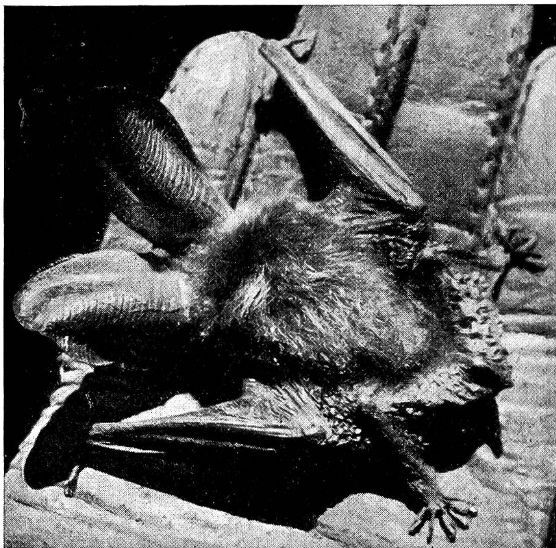
In der Schweiz gibt es über 20 verschiedene Arten von Fledermäusen; die Langohr-Fledermaus ist eine der seltsamsten von allen.

getrennt, so erhebt es sofort seine helle Stimme und gibt nicht eher Ruhe, als bis die Mutter zu ihm zurückkommt, es geschickt aufnimmt und mit ihm weiterfliegt. – Einem bekannten Fledermausforscher wurden einmal zwei solcher Fledermauskinder gebracht, die in der Nähe gefunden worden waren. Kurze Zeit später erschienen zwei alte Langohren und flogen aufgeregt vor dem Fenster der Gelehrtenstube hin und her. Der Forscher hatte ein gutes Herz, öffnete das Fenster und die Türe des kleinen Käfigs, in dem die jungen Fledermäuse untergebracht waren. Es dauerte nicht lange, bis jede Fledermaus sich rasch niederliess, so dass die Jungen sich an ihnen festhaken konnten, worauf sie von ihren Müttern fortgetragen wurden. H.