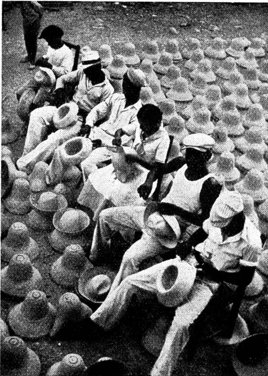
In der Hut-bleicherei wird das fertige Geflecht dem Rand nach glatt geschnitten und erhält die endgültige Form.

aber mechanisch können diese zarten Fasern geflochten werden. Daher besitzen die schwarzen Arbeiter und Arbeiterinnen auf Curaçao auch in unserem technisierten Jahrhundert immer noch ihre handwerkliche Beschäftigung, der sie, weissgekleidet und in langen Reihen unter der glühenden Sonne sitzend, obliegen, während sie die Stunden mit wehmütig klingenden Gesängen kürzen. Die Hände tun ihren Dienst im Rhythmus der Melodien fast von selbst; und was tägliche Mühe wäre, wird beinahe Spiel. Die einen sortieren die Agavenfasern, die andern flechten mit emsigen Händen, wiederum andere schneiden den Hutrand glatt oder legen die Hüte an der grellen Sonne zum Trocknen und Bleichen aus.