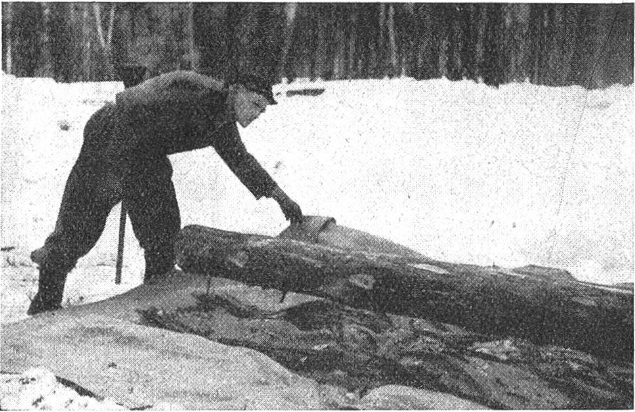
Entrinden der von Borkenkäfern befallenen Stämme auf einer Tuchunterlage.

dem von ihr befallenen Waldbaum, weshalb man sie leicht darnach bestimmen kann. Der besonders schädliche achtzählige Fichtenborkenkäfer, von dem hier ein stark vergrößerter Vertreter abgebildet ist, wird nach der eigentümlichen Form seiner Mutter- und Larvengänge landläufig auch „Buchdrucker“ genannt.