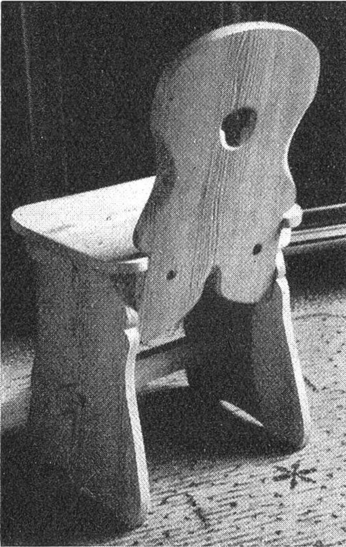
Die selbst gezimmerte Stabelle wirkt durch ihre einfache Form und die sichtbare Maserung des Holzes besonders schön.

3. Die Zapfenlöcher werden in knapp Zapfendicke gebohrt, ausgestemmt und die Zapfen eingepasst (Spiralbohrer und Stechbeitel). Dabei ist bei der Stabelle auf die Schrägstellung der Seiten Rücksicht zu nehmen.