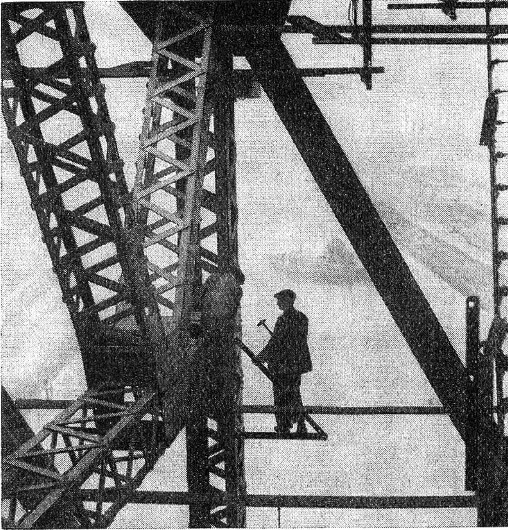
Monteure an der Arbeit auf der Brücke in Newport (England).

seh-Antennen haben die 400 m Höhengrenze überschritten, als wollte der Mensch den Himmel stürmen. Millionen von Nieten und Schrauben, Tausende von Tonnen Stahl und Eisenbeton, gepresste Stahldrahtkabel und -trossen, die aufgelöst den Umfang der Erde an Länge übertreffen würden, verankern und sichern unsere Hochbauten, deren Standfestigkeit auf genauester Berechnung und einzigartiger Güte des Baumaterials beruht. Unsere Funktürme weisen zuweilen bei starkem Wind Schwankungsausschläge von 5 und 6 m auf und stehen meist nur auf schmalstem Grund, ja sogar auf Gelenkbasis.