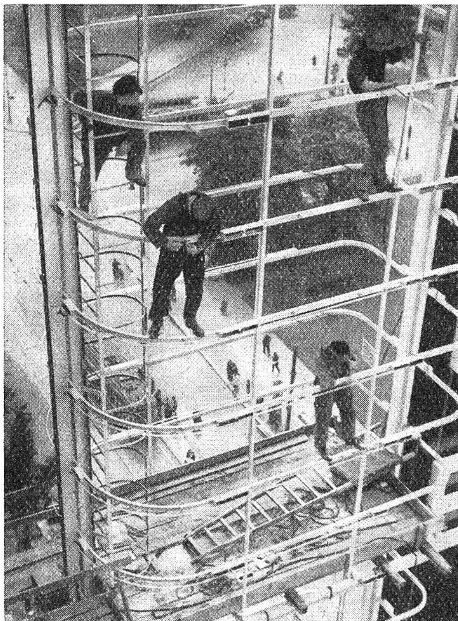
Auf einem Eisengerüst von 60 m Höhe wird eine Lichtreklame angebracht.

struktionsarbeiten einbezogen sind – uns interessiert der Mensch, der Arbeiter, Monteur, Ingenieur. Wie eine menschliche Spinne kletternd, geht er festen Griffs und sichernden Schritts in schwindelnder Höhe seiner Arbeit nach. Wo es möglich ist, hält ihn ein Sicherungsseil. Aber gefährlicher als das Ausgleiten ist der Schwindel, und erfahrungsgemäss sind nur wenig Menschen ganz schwindelfrei. Gewiss helfen Gewohnheit und Übung vieles überwinden, doch es kommt noch ein weit gefährlicherer Feind hinzu, die Angst, die furchtbare menschliche Angst. Es gibt unter den wagemutigsten unserer Monteure auf schwindelnder Höhe wohl kaum einen, der nicht von diesem Todfeind seines Berufs rückschauernd zu erzählen wüsste.