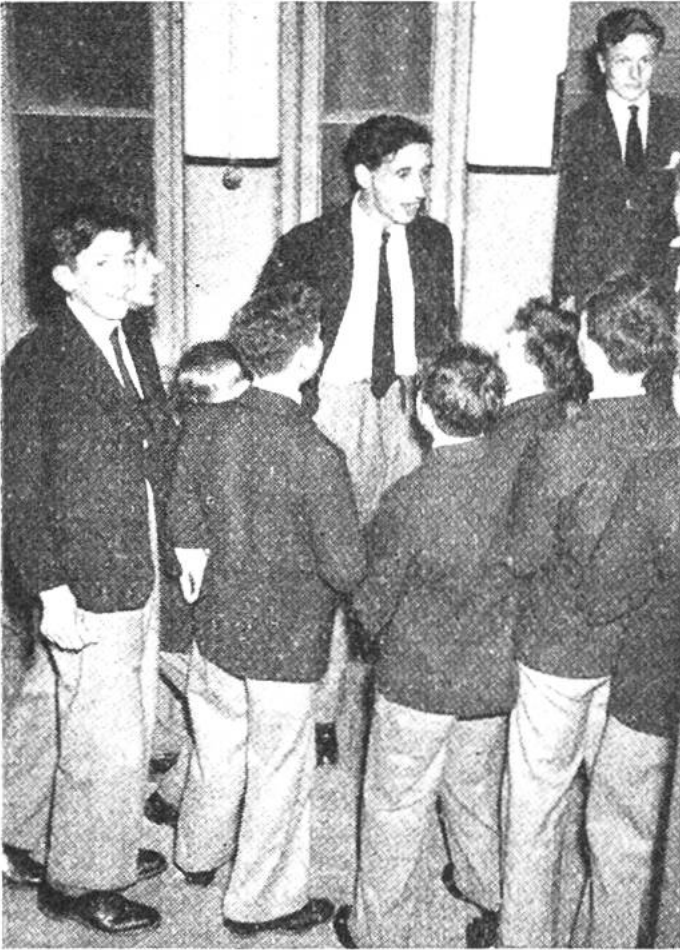
Die Junioren und ihr „Fuchsmeister“.

schwächeren durch die stärkeren Schüler nicht einreißt, und sind verpflichtet, Verfehlungen gegen den guten Geist der Schule durch Anzeige beim Direktor zu ahnden.