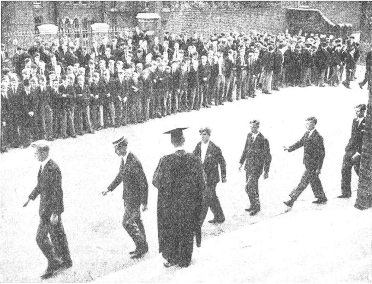
Appell im Schulhof. Wer zu spät kommt, muss bis zum Schluss warten und erhält eine Strafe.

Stiftungsschulen mit Internat. Sie heissen Public Schools, weil sie die Schüler für die öffentlichen Dienste in Armee, Flotte, Politik und Verwaltung vorbereiten. Die berühmtesten Public Schools in Eton, Harrow, Rugby, aus denen bedeutende Männer des öffentlichen Lebens und der Kunst, wie der Dichter Byron, die Minister Lord Palmerston und Churchill, hervorgegangen sind, nehmen Schüler auf, die ihre Vorbildung in ebenfalls privaten Preparatory Schools (Vorbereitungsschulen) erhalten haben. Sie sind meistens in sechs Jahresklassen, sogenannten Forms (12. bis 18. Lebensjahr), eingeteilt. Die Schüler der obersten Klasse (prefacts) haben bedeutenden Einfluss auf die Erziehung der jungen Kameraden und sind verantwortlich für die Schuldisziplin. Sie haben in den Schlafsälen des Internats, beim Spiel, bei Ausflügen, bei Freizeit und Feiern die Aufsicht und eine beschränkte Strafgewalt. Sie wachen darüber, dass die Unterdrückung der