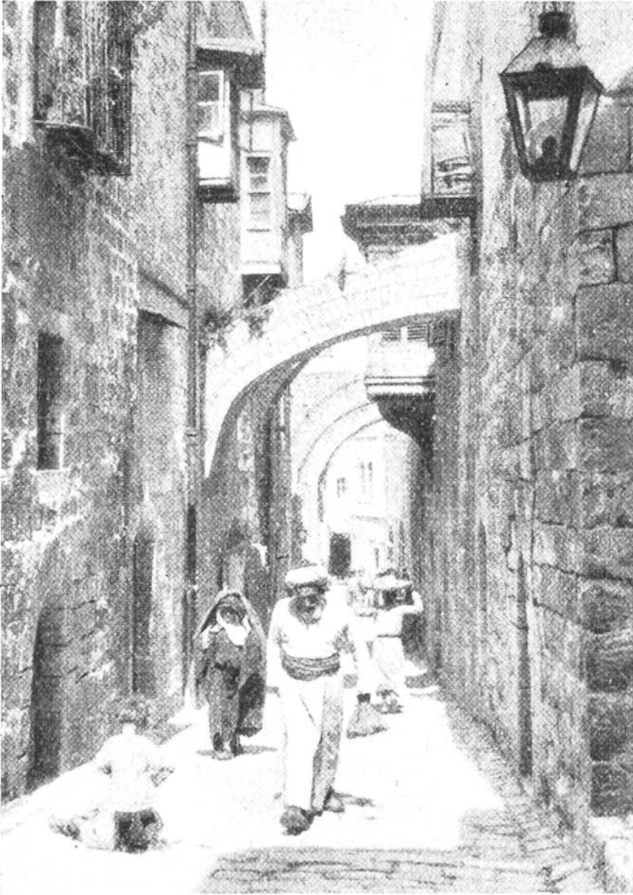
Der „Heilige Weg“ (Via Dolorosa) in Jerusalem.

Industrie, Gewerbe und Handel haben noch gewaltige Nacharbeit zu leisten, um den Wohlstand anderer Mittelmeerländer gleicher oder ähnlicher Naturbedingungen zu erreichen. Aus dem Toten Meer sind Kali und Brom zu holen, die Zement- und Baumaterialienindustrie steht in verheissungsvollen Anfängen. Eisenbahnlinien und moderne Strassen durchziehen bereits das Land. Es wird der Einsicht und der Vernunft der Leiter des neuen Staates sowie der Führer der arabischen Bevölkerung anheimgegeben sein, ob sich das Land friedlich entwickle. Gerade in der gegenseitigen Duldung und Verträglichkeit werden sich die am Werk befindlichen staatsgründenden