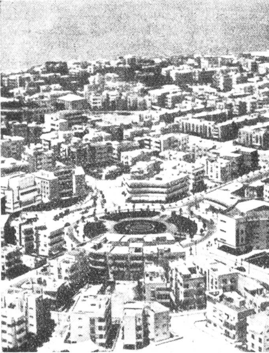
Tel Aviv, die von jüdischen Siedlern erbaute „modernste Stadt der Welt“:

den Kräfte des jüdischen Volkes, die ohne Zweifel die vorwärtsdrängenden Antriebe des Landes sind, als wohltätige und sittliche Kräfte erweisen müssen.