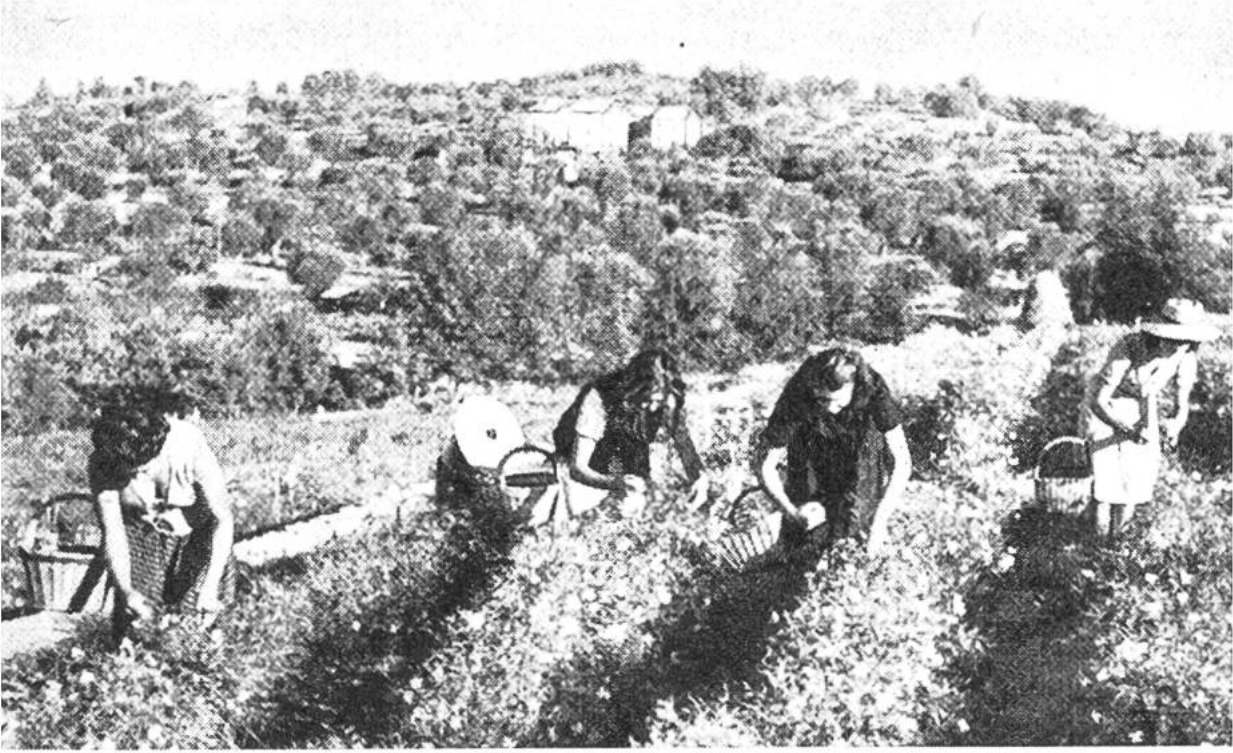
In den Jasminfeldern Südfrankreichs: Blütenpflücken im Morgendämmern.