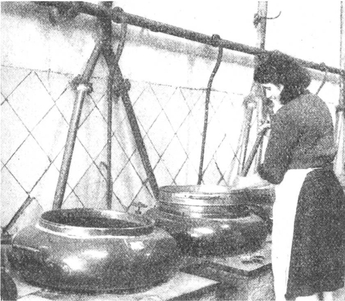
Rosenblüten werden in geschmolzenem Fett eingeweicht, welches im Wasserbad erhitzt wurde.

Jasminblüten, 2 Millionen kg Rosenblüten und 2 ½ Millionen kg Blüten von Bitterorangen destilliert. Auch Nelken, Veilchen, Lavendel, Zitronen und selbst ausländische Rohstoffe, wie Moschus, werden zu Parfüm verarbeitet und als solches in die verschiedensten Länder versandt.