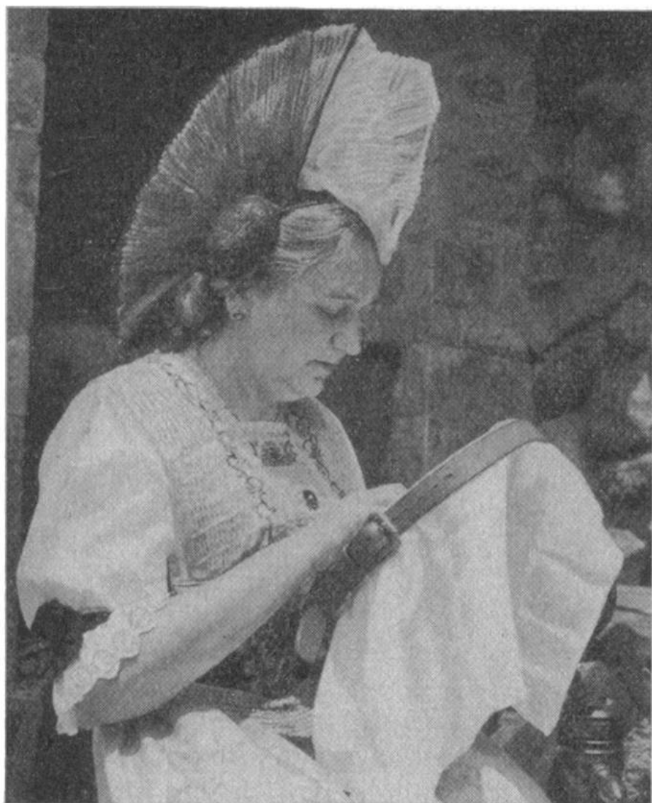
Eine Appenzellerin am Stickrahmen - in den USA.

genen Schulen geschaffen haben. Die meisten von ihnen finden wir in Italien: in Catania, Domodossola, Florenz, Genua, Luino, Mailand, Neapel und Ponte San Pietro (Bergamo). Die Spanien-Schweizer haben die erwähnte Schule in Barcelona und eine solche in Santander errichtet. In Ägypten gibt es ebenfalls zwei Schulen, die eine in Alexandrien, die andere in Kairo. In Südamerika haben die Schweizerkolonien in Santiago (Chile), Lima (Perù) und Bogotá (Kolumbien) Schulen gegründet. Warum diese Schweizerschulen entstanden sind? In vielen Ländern war früher und zum Teil heute noch das Schulwesen nicht so gut entwickelt wie in der Schweiz, und die Schweizer Eltern, welche ihren Kindern mindestens die gleiche Schulung zukommen lassen wollten, wie sie sie in der Heimat genossen hätten, wurden dort vor eine schwierige