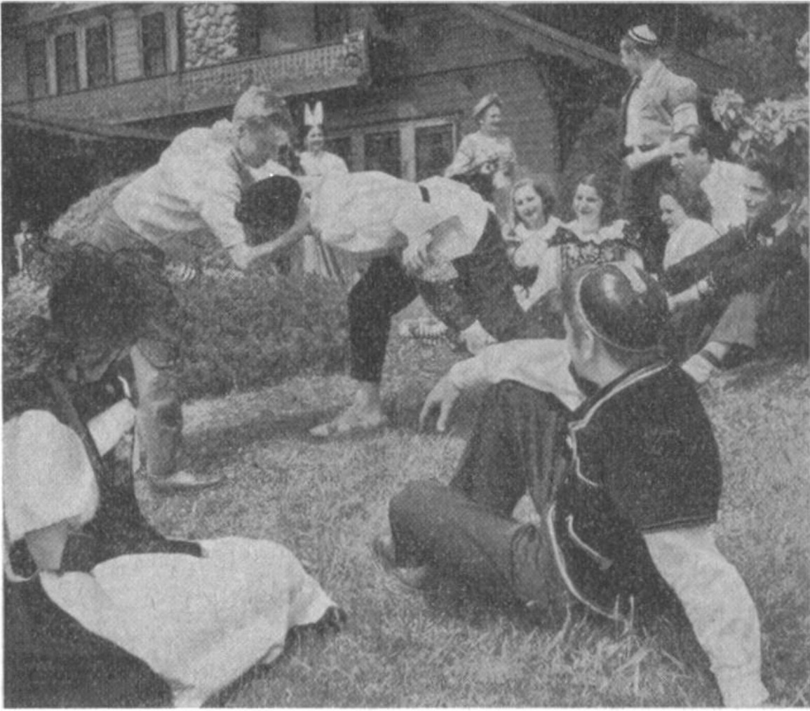
Auslandschweizer-Schwinget. Auch jenseits der Meere wird der Nationalsport nicht vergessen.

Schweiz und in der heimatlichen Geschichte zeigte sich der Knabe gut beschlagen und antwortete auf unsere erstaunte Frage, das alles habe er eben in der Schweizerschule in Barcelona gelernt.