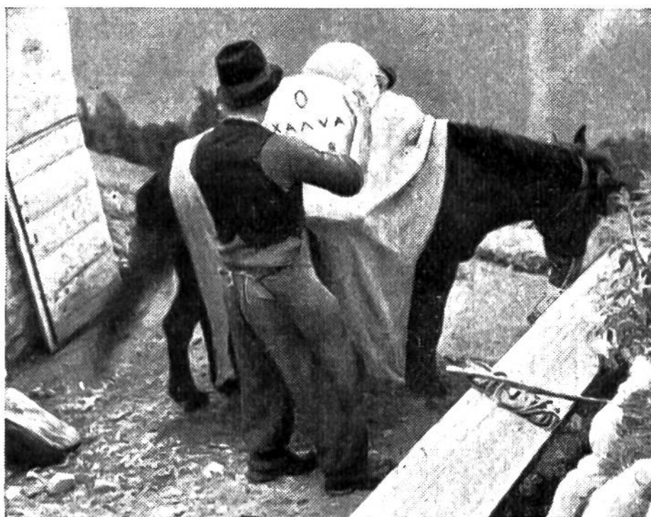
Die gepressten jungen Käse werden auf ein Maultier geba- stet und zum Käsekeller im Tal gebracht.

Die Käsebereitung auf den Alpen ist seither stark zurückge- gangen. In reinen Alpenkantonen aber kennt man auch heute noch die regelmässige Kuhalpung und die sommerliche Alp- käserei. Die Sennen stellen dabei meistens einen vollfetten