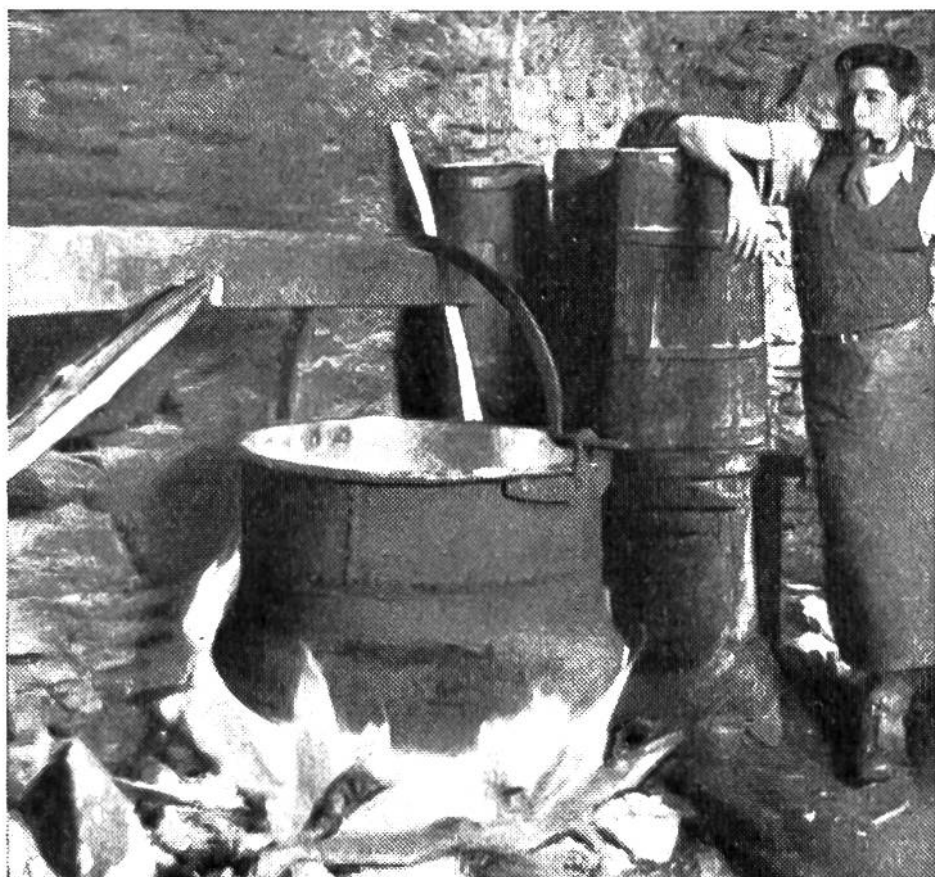
Am Herdfeuer der Sennen. Das Käsen be- ginnt.

Die Käsebereitung auf den Alpen ist seither stark zurückge- gangen. In reinen Alpenkantonen aber kennt man auch heute noch die regelmässige Kuhalpung und die sommerliche Alp- käserei. Die Sennen stellen dabei meistens einen vollfetten