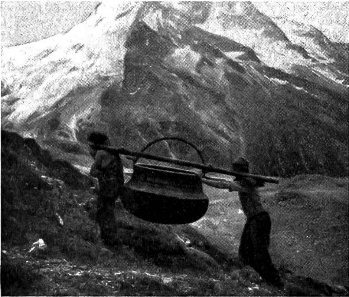
Zwei Sennen tragen das schwere kupferne Käskessi vom untern nach dem oberen Alpstafel.