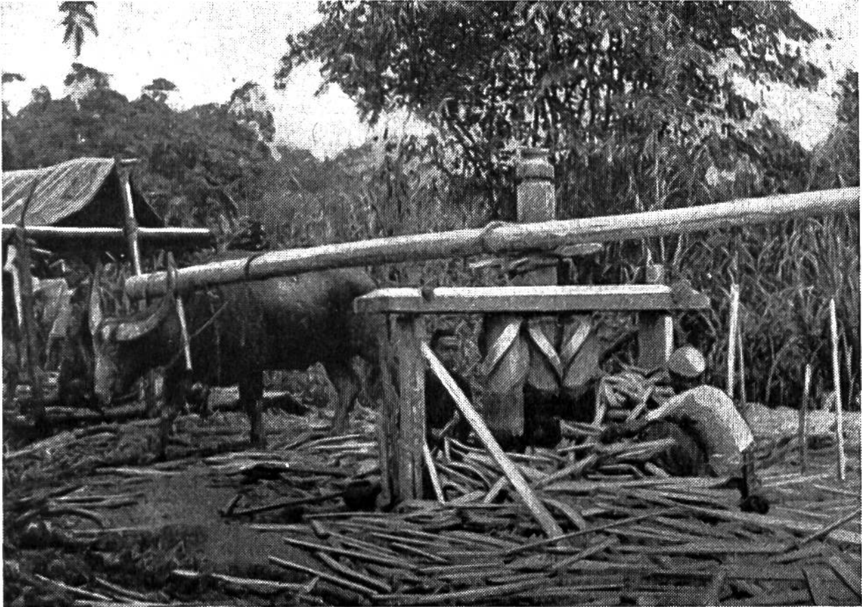
Eine primitive Zuckermühle der Malaien, die den süßen Saft aus dem Zuckerrohr presst.

Zuckerrohrstecklinge, wie dies zum Beispiel in Louisiana geschieht. In den Plantagen Kubas nimmt man dagegen von den gleichen Pflanzen bis zu sieben Ernten, indem man die Wurzelstöcke einfach wieder treiben lässt. Bei einer Neupflanzung dauert es elf Monate bis zur Schnittrife, in höheren Lagen noch länger. Das Zuckerrohr wird ausschliesslich von Hand mit der Machete (Haumesser) geerntet; den Zuckerrohranbau findet man aus diesem Grunde nur dort, wo zahlreiche billige Arbeitskräfte zur Verfügung stehen. Die äusserst primitive Lebensweise und die geringen Ansprüche der schwarzen Plantagenarbeiter haben zur Folge, dass der europäische Rübenbauer, der mit weit höheren Löhnen rechnen muss, beim Auftreten von Zuckerüberschüssen auf dem Weltmarkt sein Auskommen oft kaum mehr finden würde und daher in vielen Staaten einen gewissen Zollschutz genießt. Die Erhaltung des europäischen Zuckerrübenbaues dient auch der Vorsorge für Kriegs- und Notzeiten.