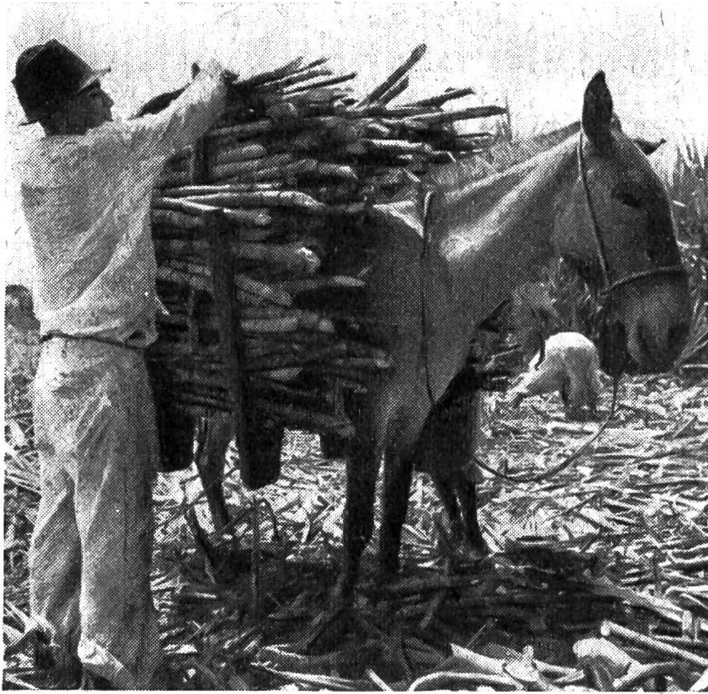
Geduldige Maulesel befördern das geschnittene Zuckerrohr zur Raffinerie.

kriegsmenge von rund 30 Millionen Tonnen wieder erreicht. Die wichtigsten Anbau- und Ausfuhrländer für Zuckerrohr sind heute Indien, Kuba, Java, Formosa, Brasilien, die Philippinen, Hawaii, Puerto Rico und Australien. Das Zuckerrohr, eine in mehreren wilden Arten und Zuchtsorten vorkommende Gattung der grossen Familie der Gräser, stellt hohe Ansprüche an Klima und Boden. Es gedeiht am besten bei einer mittleren Jahrestemperatur von 20^{\circ} und einer jährlichen Regenmenge von mindestens 1000 mm. Die Ernte dagegen sollte in eine Trockenperiode fallen. Je nach Sorte und Anbauverhältnissen beträgt der Zuckergehalt 9–15%. Zuckerrohrkulturen sind ausgesprochene Düngereisser. Kunstdünger ist daher im Austausch mit Rohrzucker ein wichtiger Artikel im Fernostverkehr des Suezkanals. Die höchsten Zuckererträge gibt es bei alljährlicher Neupflanzung der