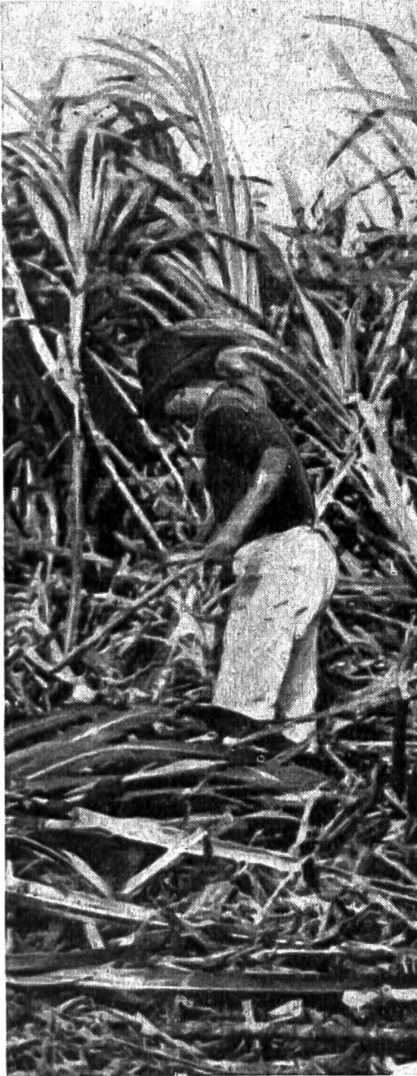
Ernte des über mannshohen Zuckerrohrs mit der Machete.

Kaum sind die internationalen Versorgungsschwierigkeiten des letzten Weltkrieges für Zucker einigermaßen überwunden,