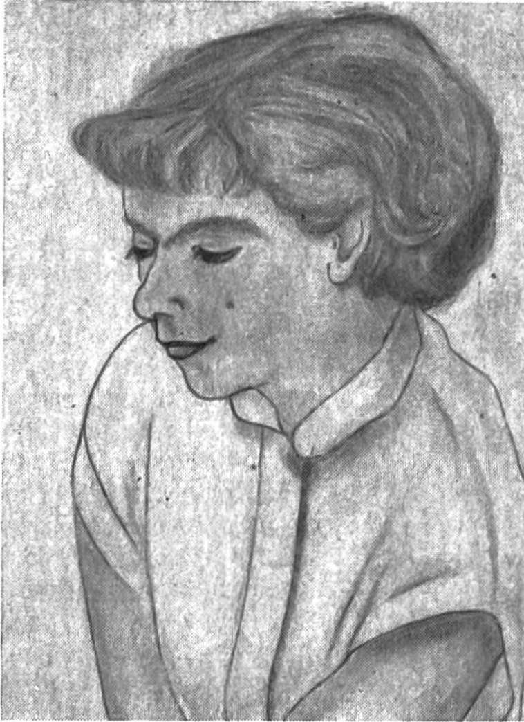
„Meiti beim Lesen“, Bleistiftzeichnung nach Natur von Cornelia Koster (15 Jahre), Zürich.

Einige Vorschläge zum Zeichnen nach eigener Phantasie: