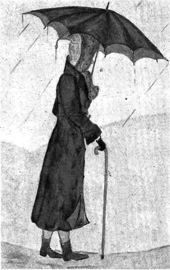
„Die vom Regen überraschte Grossmama“, Aquarell nach Phantasie von Marianne Schneider (13 Jahre), Bern.

gebung. Zeichnet ähnlich den kleinen Kindern, die sich nicht auf das genaue Abzeichnen irgendeines Gegenstandes oder einer Landschaft verlegen, sondern mit dem Stift auf das Papier zaubern, was sie träumen und sinnen, ein Stück Gedankenwelt, in der sie leben. Doch da ihr keine kleinen Kinder mehr seid, werdet ihr anders zeichnen, eurer Gedankenwelt und eurem Können entsprechend. Zeichnet Lustiges oder Ernstes aus wirklicher oder erdachter Welt, einen Wunsch, eine Erinnerung, einen tiefen Eindruck oder einen Traum; gerade das zeichnet, was euch einfällt, wozu ihr eben Lust und Freude habt; schreibt auf einem zweiten Blatt einen begleitenden Text dazu. Die Wettbewerbsbedingungen sind auf den Seiten 113–115 und 121 zu finden; Bestätigung nicht vergessen!