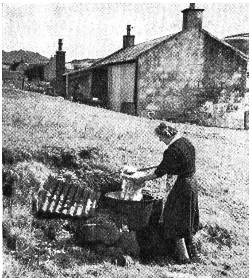
Das Färben der sauber gewaschenen Wolle mit natürlichen Farben erfolgt über einem Torffeuer im Freien.

als 10 Grad unter Null und steigen sozusagen nie über 25 Grad. Bei der Ungezieferarmut und dem milden Winter gehen die Schafe fast während des ganzen Jahres auf die Weide.