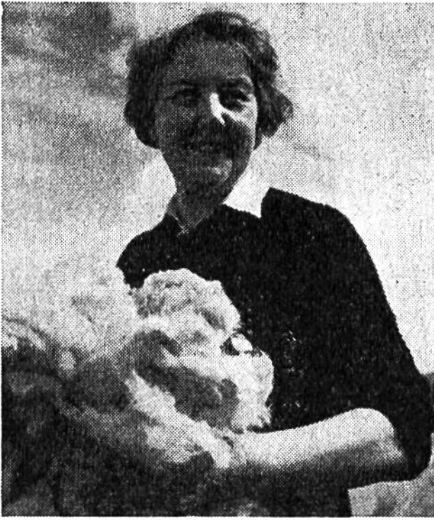
Vollstolz zeigt diese schottische Bäuerin den Wollertrag eines Schafes.

Millionen Schafe, wobei heute die grössten Wolllieferanten auf der südlichen Halbkugel zu finden sind. Auf den britischen Inseln steht die Schafzucht seit Jahrhunderten in Blüte. Unsere Bilder zeigen, wie auf der Skye-Insel der schottischen Hybriden noch nach alter Väter Sitte Schafwolle zu solidem Wollgewebe verarbeitet wird. Obwohl die baumarmen Weideflächen und die düsteren Moore der zum schottischen Hochland gehörenden Bergland-