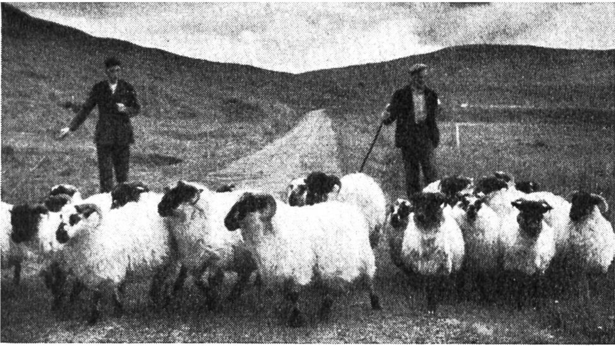
In Tweed gekleidet, treiben zwei Hirten ihre Schafe auf die schottische Heide hinaus.