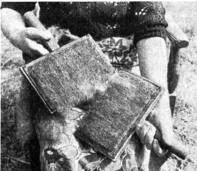
Wollbearbeitung mit der Karde vor dem Verspinnen.

schaft rauh genug zu sein scheinen, kennt dieses nördlich gelegene Land ein ozeanisch mildes Klima mit allerdings sehr häufigen Regen- und Nebeltagen, aber verhältnismässig wenig Schneefällen. Die Temperaturen sinken selten tiefer