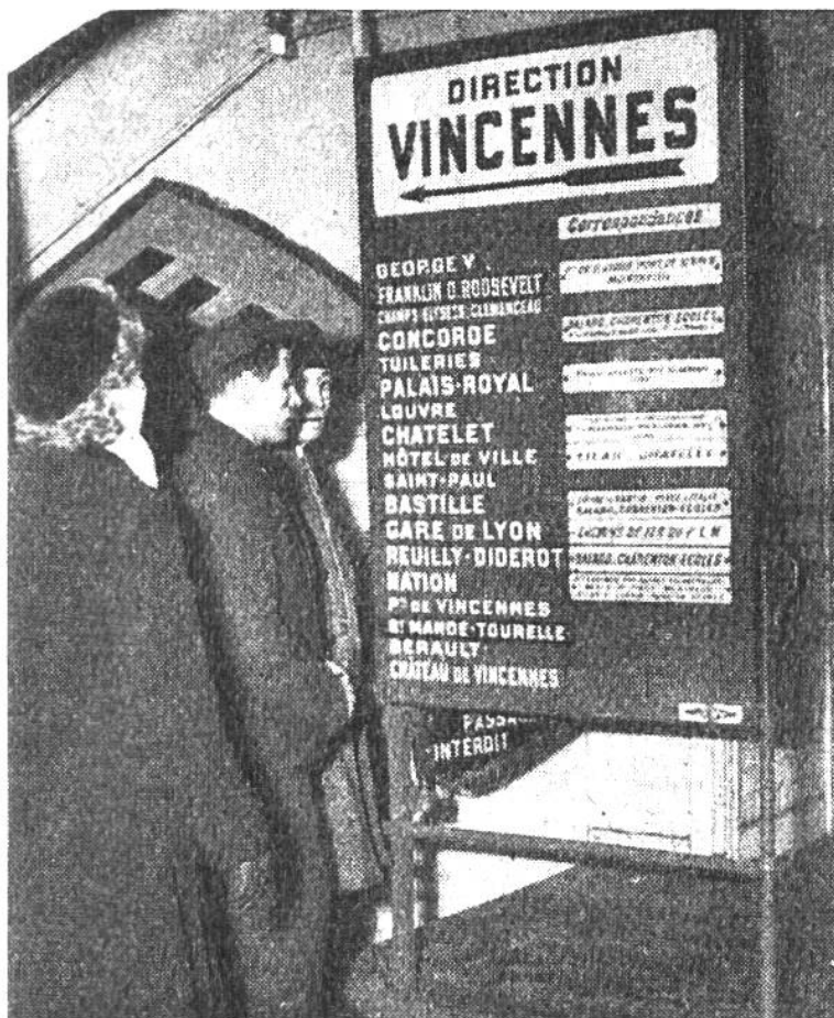
Eine Orientierungstafel im Bahnhof Etoile. Links sind sämtliche Stationen der Linie Richtung Vincennes angegeben, rechts die Umsteigemöglichkeiten auf diesen Stationen in andere Linien. Für jede Linie und jede Richtung gibt es, oft mehrstöckig übereinander, einen besonderen Bahnsteig.