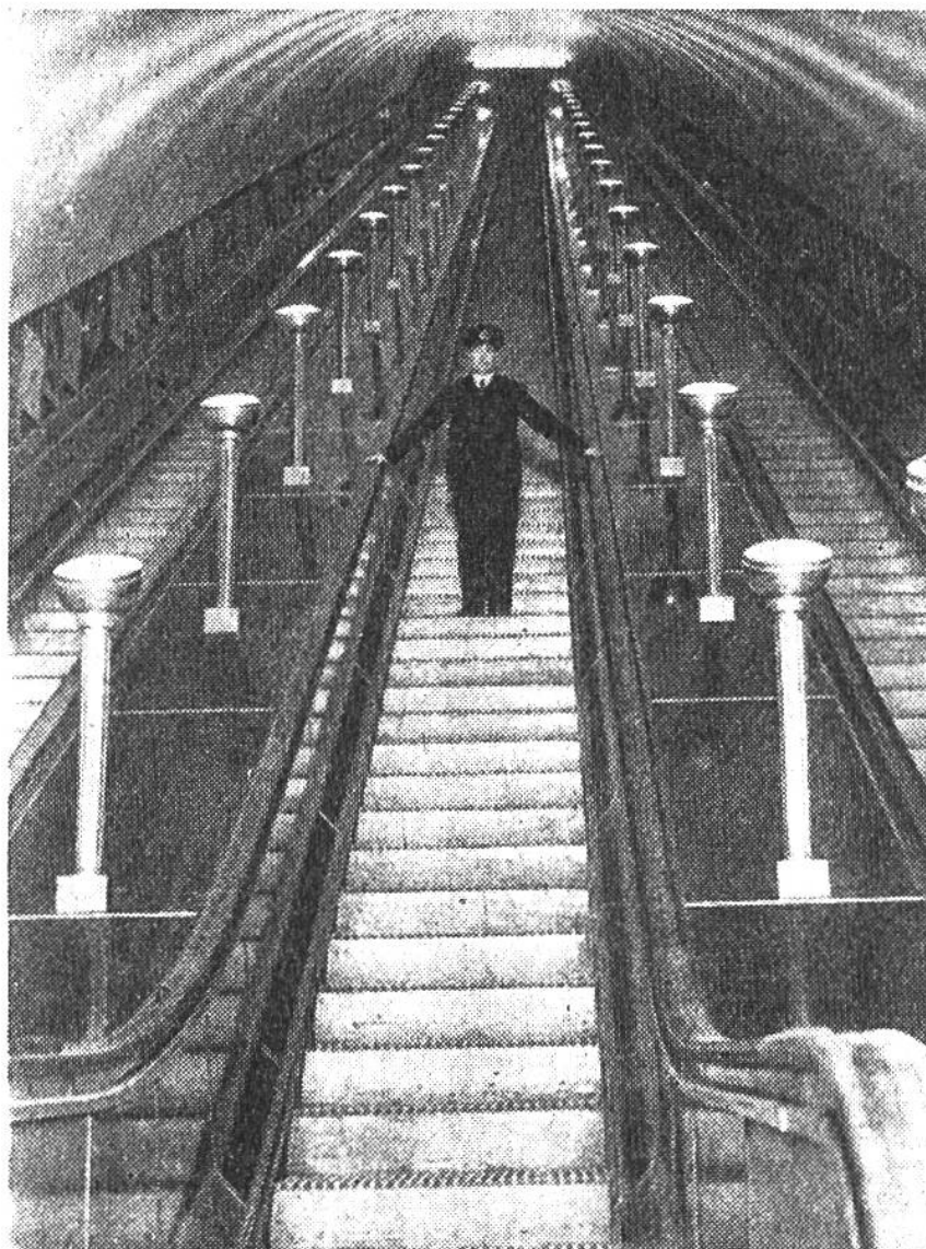
Die Rolltreppen der Station Leicester Square in London; sie führen zu den im Stadttinnern tief in der Erde befindlichen Untergrundbahnlinien. Jedes der Treppenbänder weist 304 Stufen auf und ist 53 m lang. Man glaubt, in einen hellerleuchteten Saal und nicht in einen abwärts führenden Tunnel zu treten.

aus! Es werden pro Jahr etwa 73 Tonnen Einzelbillette, die sehr klein sind, und noch etwa 118 Tonnen Billettheft benötigt.