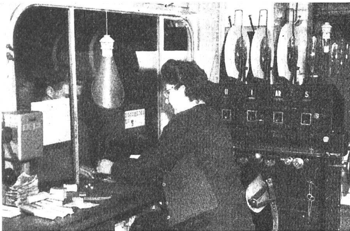
Hinter dem Billetschalter der Métro. Ein Druck auf den Knopf – und das Billet fällt automatisch herunter.