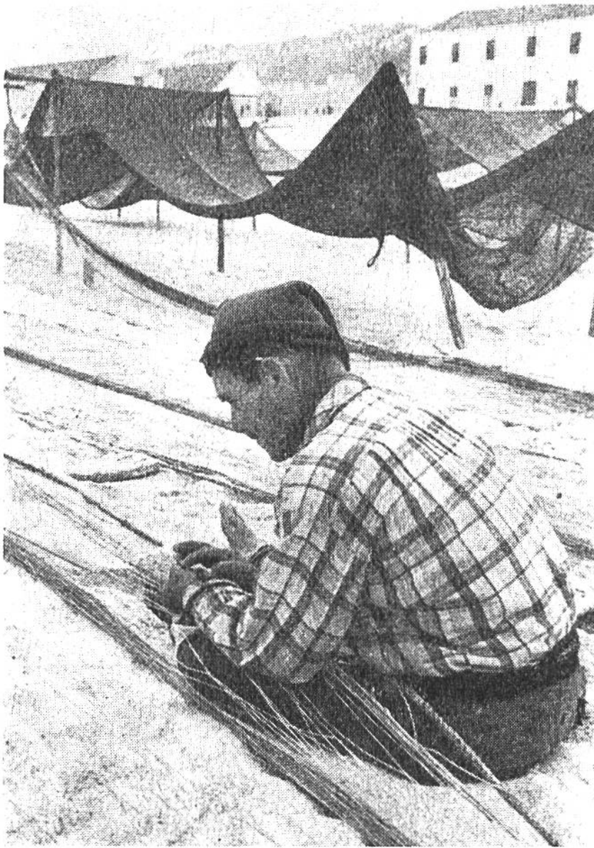
Mit den Zehen hält dieser Fischer das Netz gestrafft, um es zu flicken.

Tagen ziehen sie es mit seiner kostbaren Fracht wieder an Land. Zu zweit sind sie ins Joch gespannt, oft ein Riesengespann von zwölf und mehr Ochsen! Mit meterlangen Stangen werden die Tiere zu dieser schweren Arbeit angetrieben. Ja, das Leben in Nazaré ist nicht leicht – leicht ist allein die karierte Fischertracht, deren Hosen die Männer aufkrepeln, wenn sie barfuss am Strand arbeiten. Auf See jedoch tragen sie wetterfeste Stiefel und Kleidung. Die Frauen gehen in Schwarz und sitzen oft wartend wie eine Schar Raben am Ufer, bis ihnen die Fischer einen guten Fang ankünden. Dann werden sie sich tummeln müssen, um beim Verkauf der Fische bis tief in die Nacht hinein zu helfen!