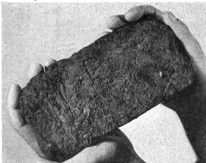
Die Siwasha-Indianer in Alaska bezahlten noch im 19. Jh. mit hartem Brot.

Europäern eingeführte Glasperlen sein, die einen gewissen Seltenheitswert besitzen und deshalb Zahlungsmittel darstellen; es mögen – in Melanesien, der im Nordosten Australiens gelegenen Inselreihe – sogar Tierzähne die Bedeutung von Geld erlangen, wobei in der üblichen Wertstufung ein ringförmig gewachsener Eberzahn den Wert von 200 Hundezähnen ausmacht. Das eigenartigste Geld auf unserem Erdrund stellen wohl die Yap-Steine dar; sie dienen auf der Insel Yap in der Südsee als Zahlungsmittel, das kaum je einer Fälschung ausgesetzt ist. Denn diese grossen und schweren Steine werden auf einer 500 km entfernten Insel gebrochen und auf eigens dazu gebauten Flößen herangeschafft, um dann – mit einem Mittelloch versehen – an Stangen über der Schulter getragen zu werden.