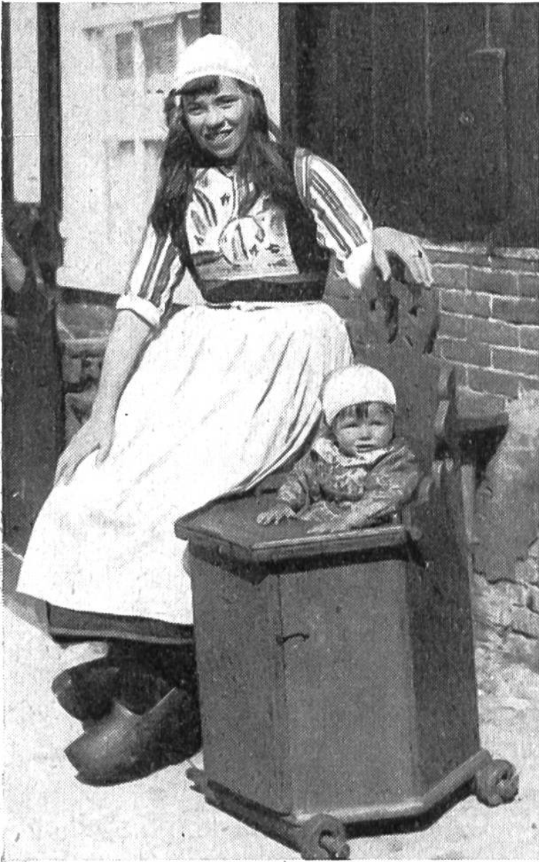
Das holländische Kleinkind auf der Insel Marken sitzt gut geschützt im soliden fahrbaren Stuhl.

haben, aus einem Fenster gefallen sind. So ist es verständlich, dass man überall Mittel gesucht und gefunden hat, um solche Gefahren zu vermindern. Nun ist es gerade bei fremden Völkern noch weniger als bei uns möglich, die Kleinen ständig zu beaufsichtigen. Sehr oft werden dort die Mütter noch stärker durch alle möglichen Arbeiten beansprucht. In diesem Fall müssen die nur wenig älteren Geschwister das Kleinste beaufsichtigen. Sobald Babies sitzen können, braucht man gewöhnlich Stühle für sie, aus denen sie nicht hinausklettern können. Meistens aber sind diese bei uns nicht so solid wie der fahrbare Stuhl von der Insel