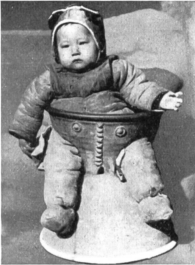
Eingemummt nach alter Weise, thront dieses Baby aus der Provinz Honan in Mittelchina auf einem scheinbar praktischen Bronzestuhl, der sich Jahrhunderte hindurch erhalten und von Generation zu Generation vererbt hat.

Marken in Holland oder gar der chinesische Bronzestuhl.