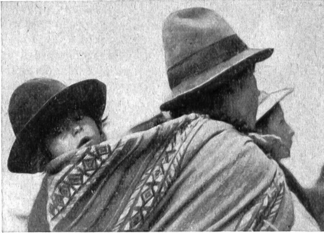
Indianische Mutter aus Cuzco (Peru), die ihr Kind im Poncho, dem wollenen Umschlagtuch, trägt.

ruanische Indianerin hat es in einem Tragtuch eingebunden, wie dies auch von vielen Negern geübt wird. Bei der Eskimofrau liegt es in der grossen Kapuze wohlgeborgen vor der Kälte. So werden die Kinder meistens nicht bloss auf dem Weg zur Arbeitsstätte, sondern auch während der Arbeit getragen. Selbst im Hause ist dies manchmal üblich. Sogar wenn die Frauen tanzen, verlässt das Kind seinen angestammten Platz nicht. Es gewöhnt sich so sehr an alle Bewegungen der Mutter, dass es von seinem sichern Ort aus ebenso vergnügt in die Welt schaut wie ein Kind bei uns aus seinem Wagen. Auch schlafen können die Babies in diesen unbequem scheinenden Lagen so gut wie anderswo im Bett oder in der Wiege.