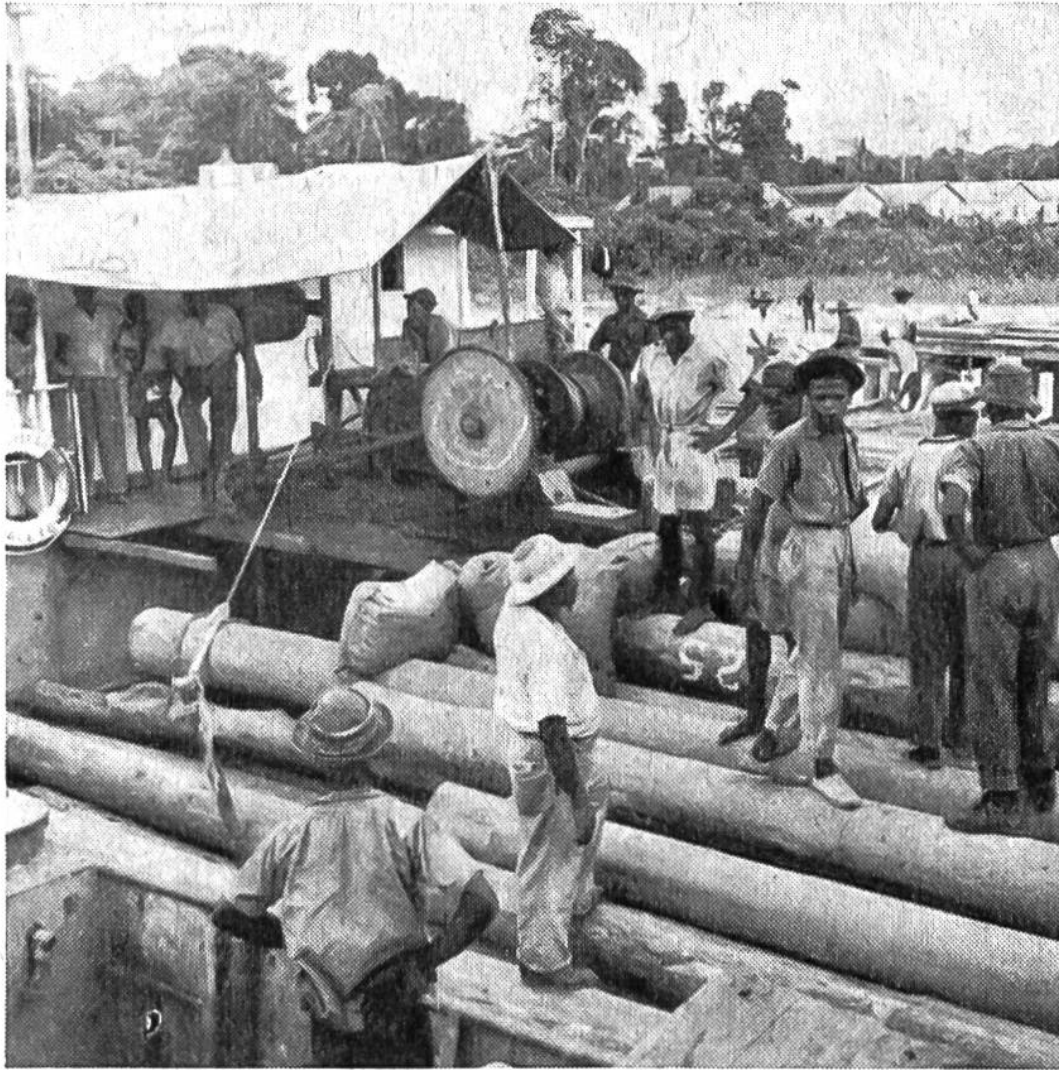
Beim Verladen des schweren Grünholzes dürfen die Flussbarken nicht überlastet werden, da sie sonst versinken.

kann daher nicht geflösst, sondern muss wie Eisen in Barken verladen werden. Da das Grünholz auch bei ständiger Feuchtigkeit sehr dauerhaft ist und selbst dem Schiffsbohrwurm und den Termiten zu trotzen vermag, braucht man es gerne im Schiffs- und Schleusenbau, für Wasserräder, Turbinen und andere Unterwasserbauten. Auch die Bildhauer schätzen das feine, harte Grünholz, das sich wie Marmor polieren lässt. – Aus der Rinde des Grünherzbaums gewinnt man ein Pflanzengift (Alkaloid), das Bebirin, das übrigens auch in unserem Buchs vorkommt. Das Bebirin dient wie das Chinin als Mittel gegen Fieber. A. B.