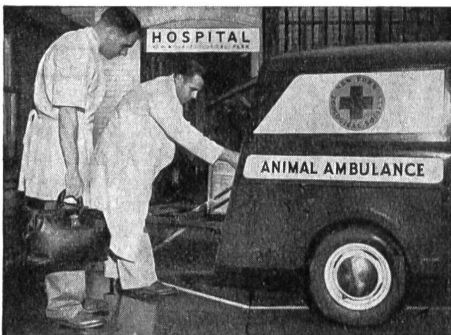
Der Krankenwagen im Bronx Zoo, der schon vielen Wildtieren rasche Hilfe und Linderung gebracht hat.