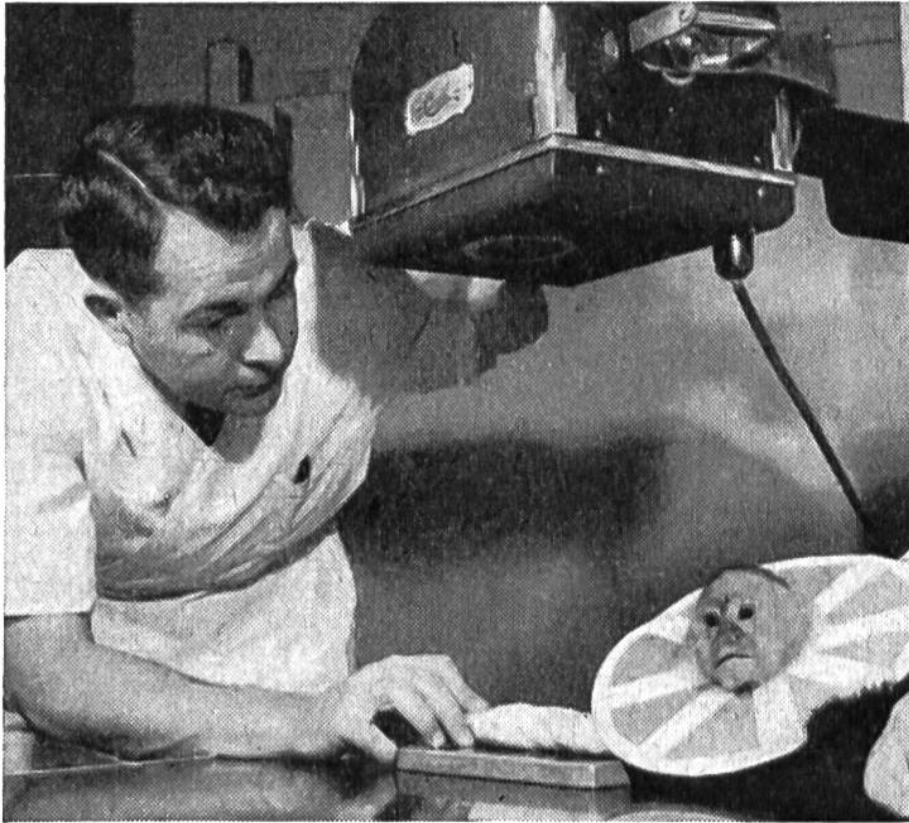
Genau wie bei einem menschlichen Patienten wird der Arm des verunglückten Affen geröntgt.

den Anordnungen. – Zum Glück kommt sehr oft eine aussergewöhnliche Heiltendenz den Bemühungen des Veterinärs entgegen. Es ist manchmal erstaunlich, wie rasch z. B. schwere Verwundungen bei Wildtieren heilen. Viele menschliche Patienten hätten Grund, die Vierbeiner um ihre ausserordentliche Heilfähigkeit zu beneiden.