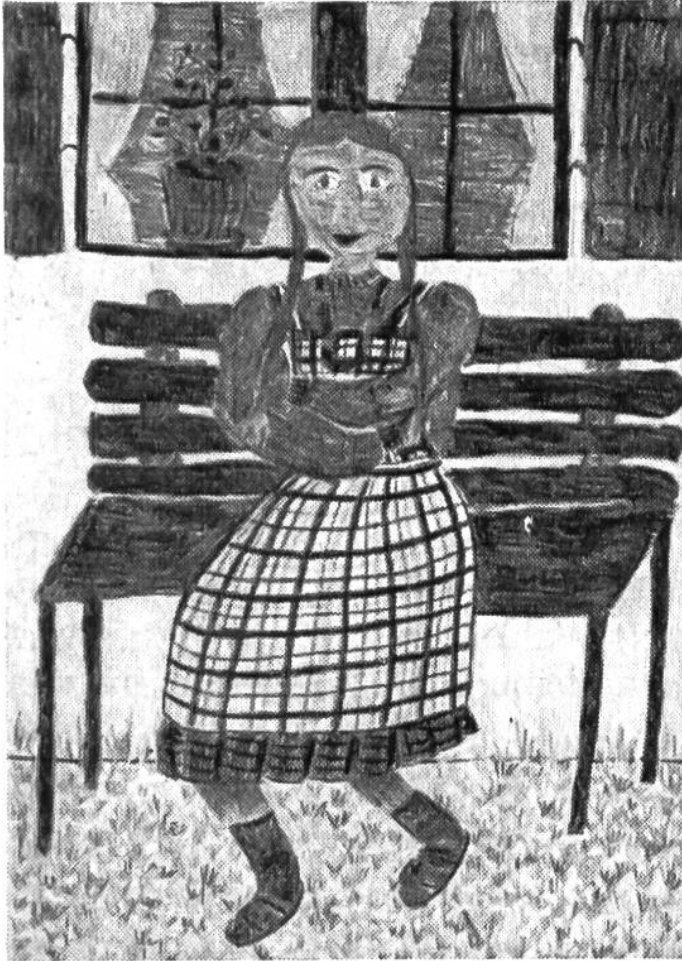
«Sitzendes Mädchen», Farbstiftzeichnung nach Natur von Julia Juon (12 Jahre), St.Gallen.

licher oder erdachter Welt, einen Wunsch, eine Erinnerung, einen tiefen Eindruck oder einen Traum; gerade das zeichnet, was euch einfällt, wozu ihr eben Lust und Freude habt; schreibt auf einem zweiten Blatt einen begleitenden Text dazu. Die Wettbewerbsbedingungen sind auf Seite 154 zu finden; Bestätigung nicht vergessen!